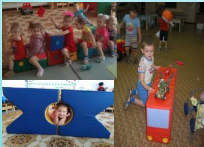
Использование мягких модулей в игровой