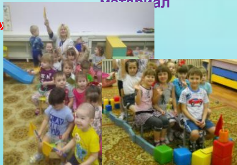
Полифункциональное использование мебели