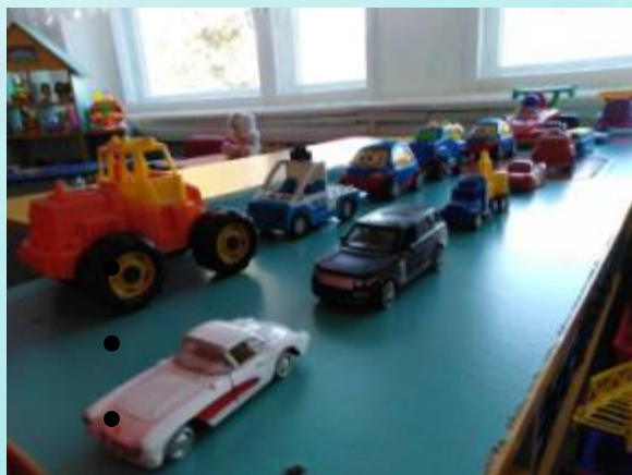
Автомобили: грузовые, легковые, спец. транспорт