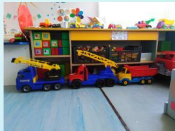
Наборы «Строитель», «Автослесарь», строительный материал