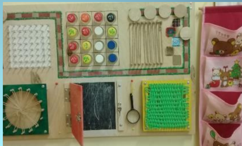
«Бизиборд» доска с разными элементами плетения