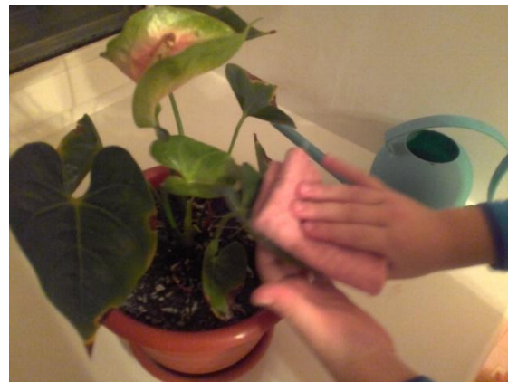
Уход за комнатными растениями