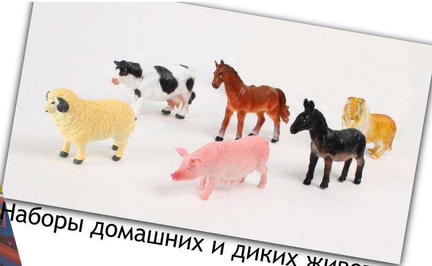
Наборы домашних и диких животных