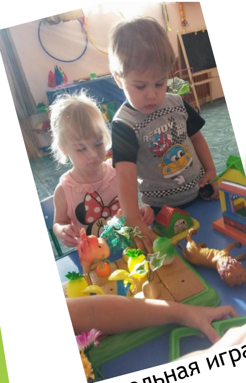
Настольная игра «Огород»

Наблюдая за растениями и животными, дети привыкают к бережному отношению к ним, приучаются к совместному труду с взрослыми, друг с другом, а затем и самостоятельно.