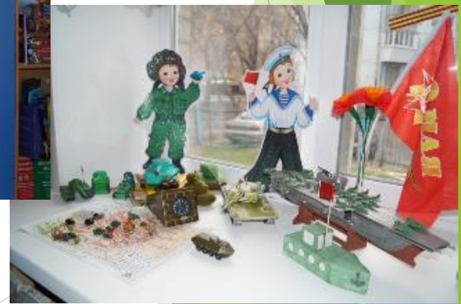
Праздник День Победы: выставка рисунков, поделок, книг, открыток, медалей, орденов.