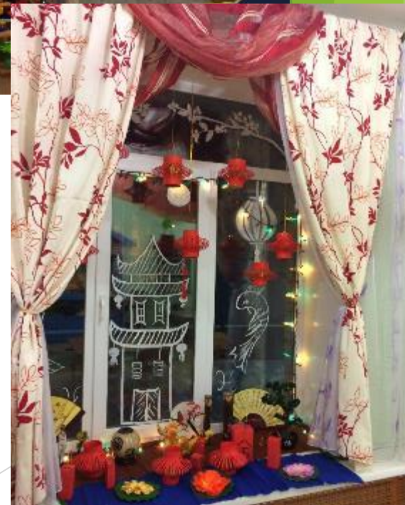
2018 год - «Новый год в Китае».