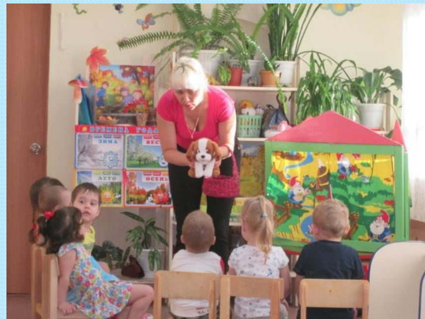
Центр «Театрализованной деятельности»