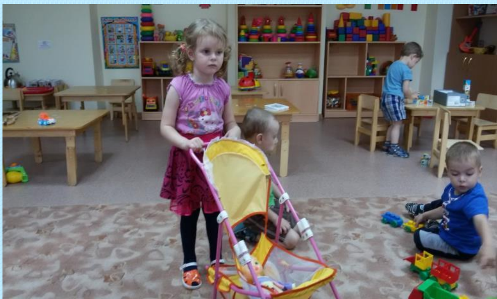
Крупные машины , игрушки каталки