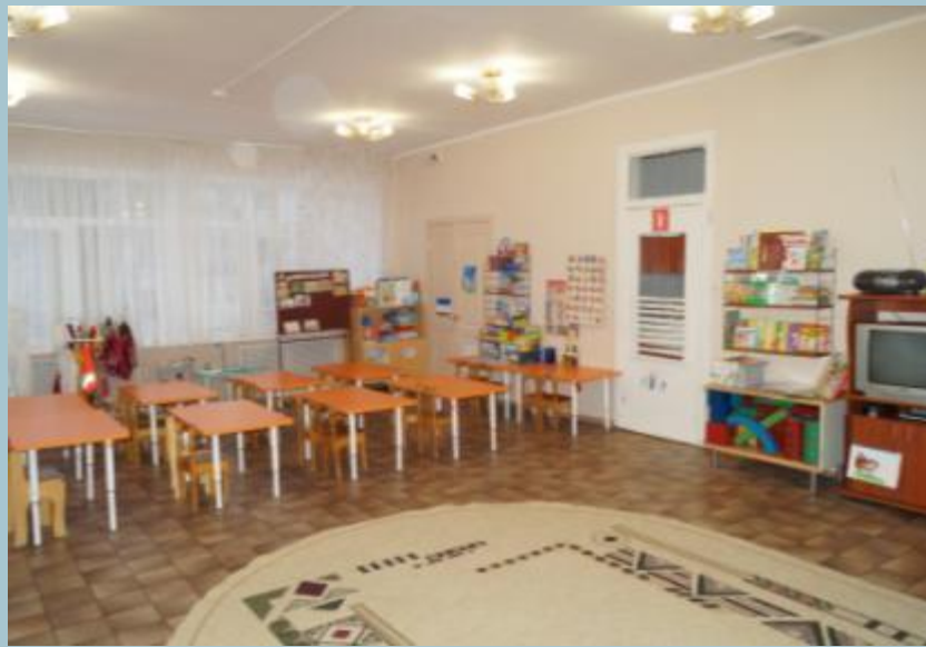
Верхняя правая точка