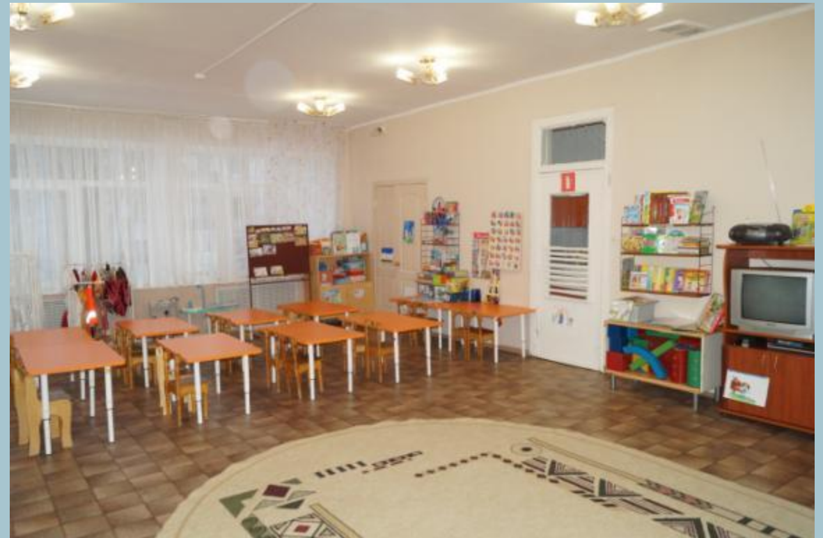
Вид из центра группы в противоположном входу направлении