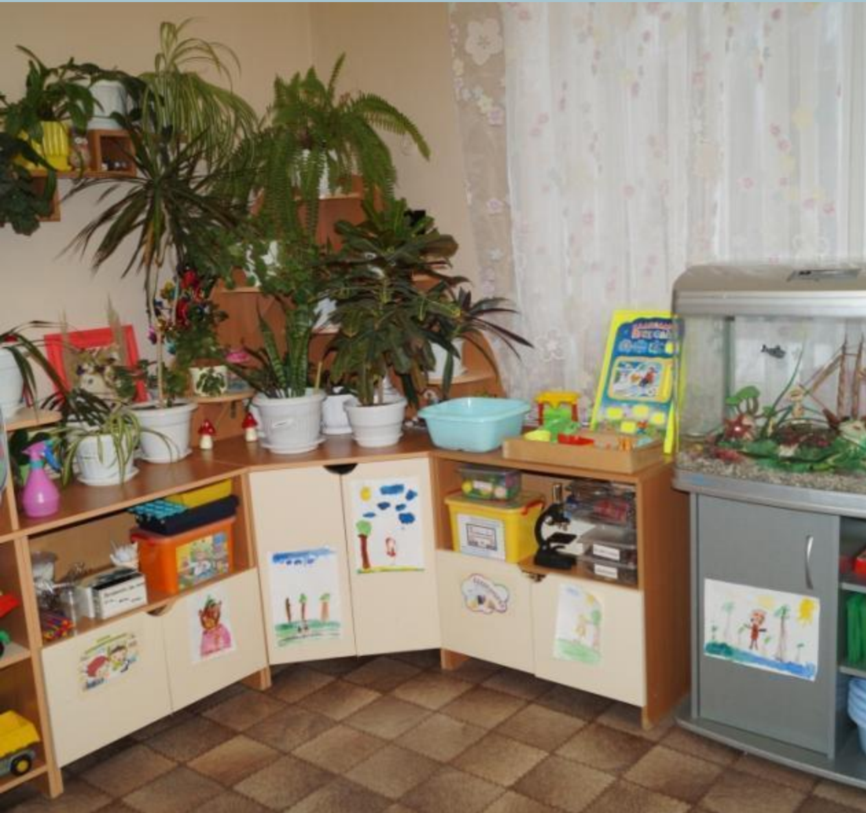
Живая и неживая природа