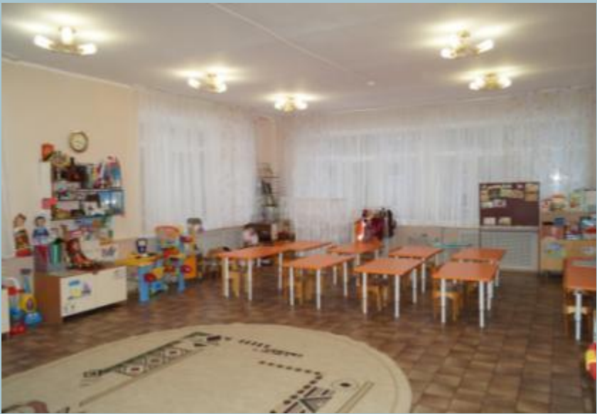
Верхняя левая точка