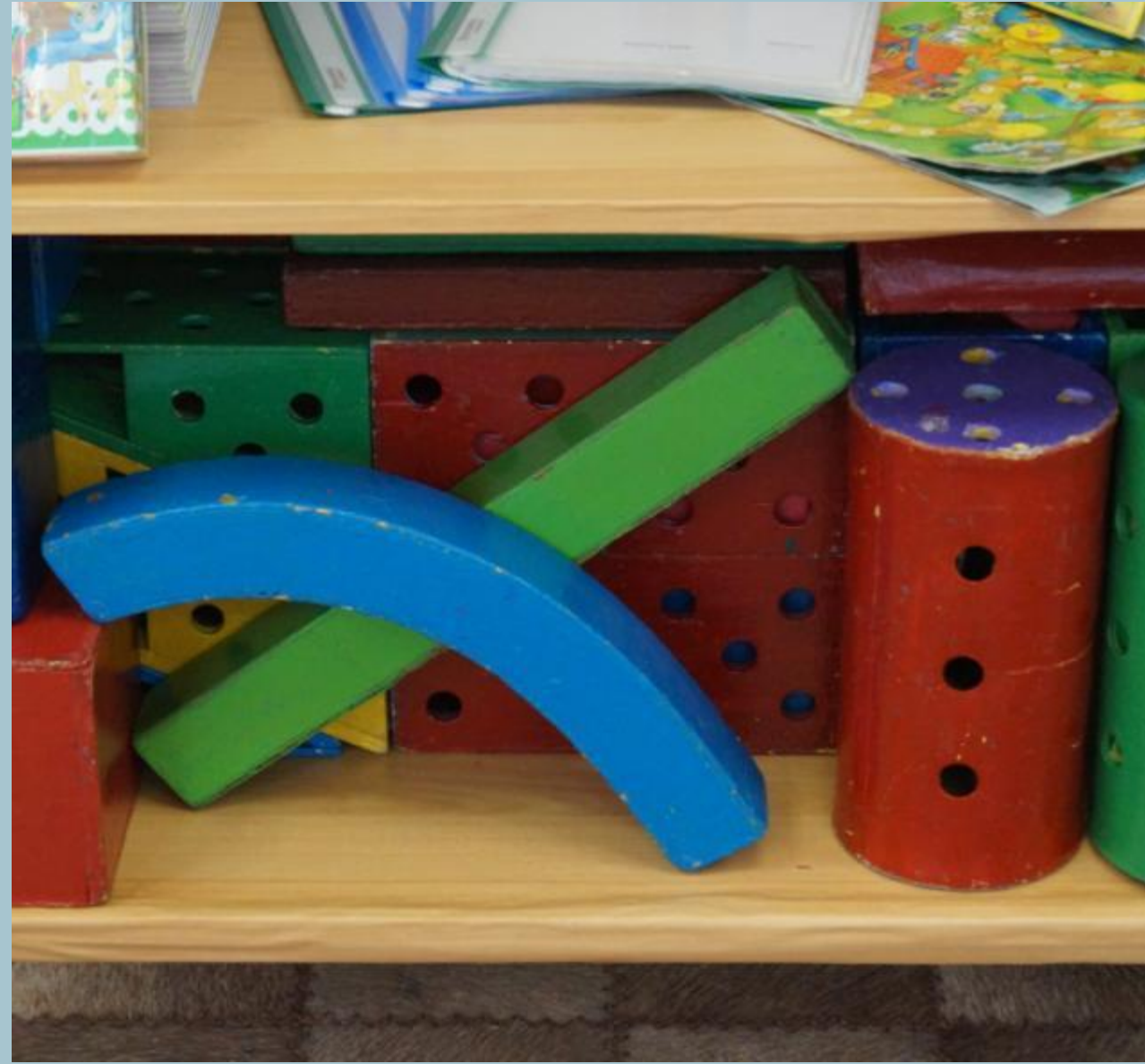
«Сенсорика – конструирование»