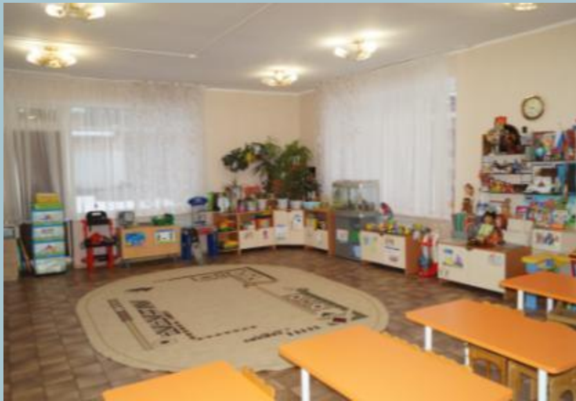
Нижняя правая точка

Вид подготовительный группы с четырех точек по периметру