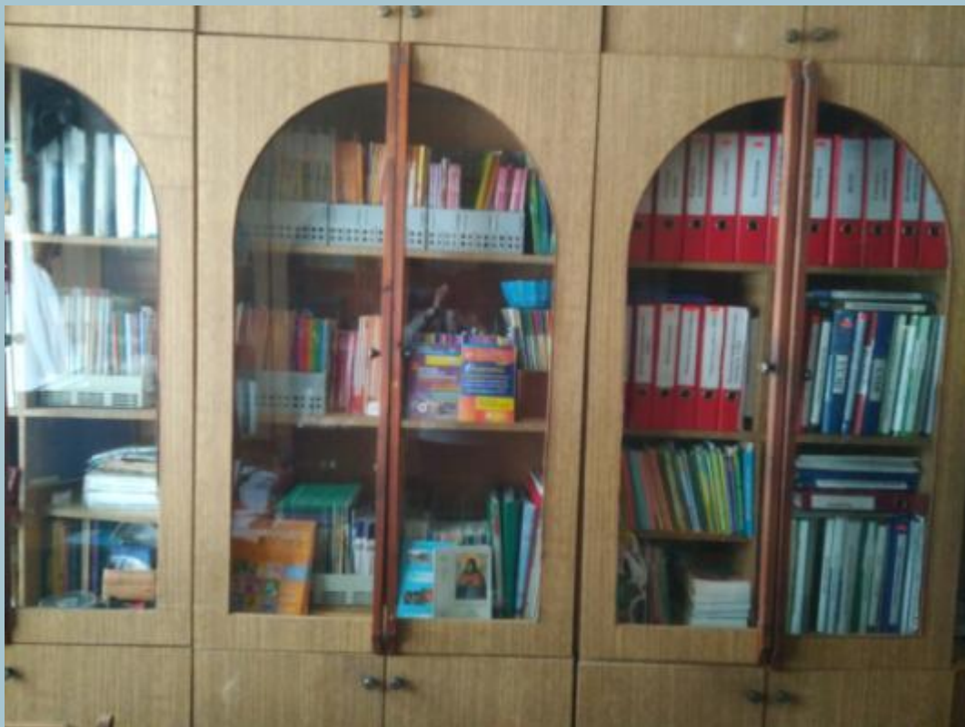
Методическая литература педагога