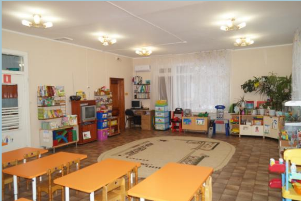
Вид из центра группы на вход в помещение