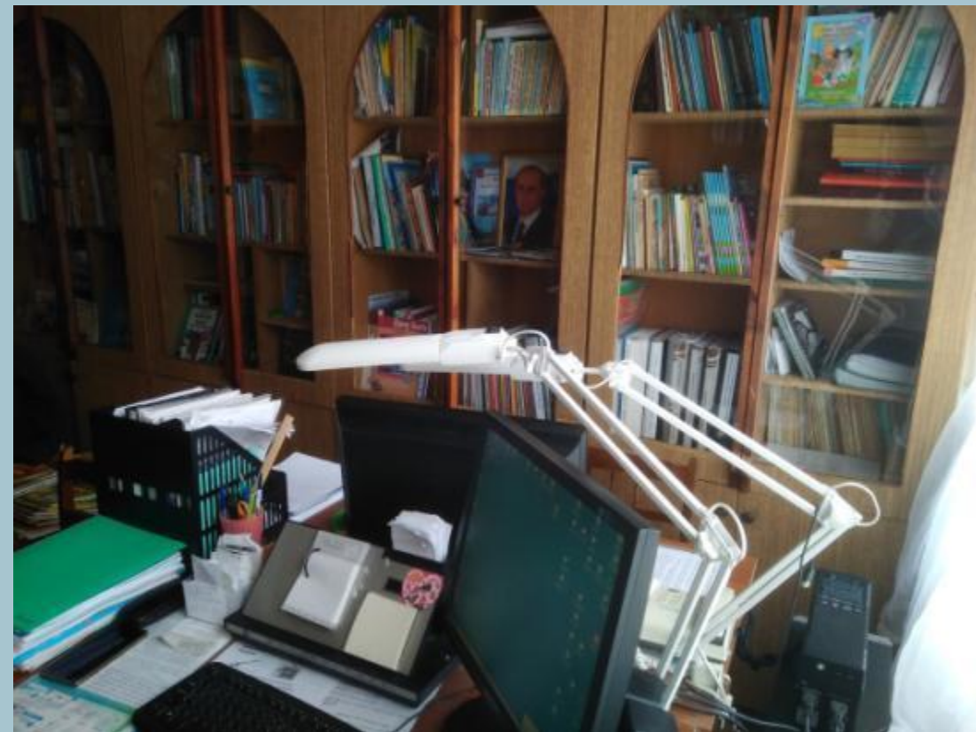
ИКТ для педагога