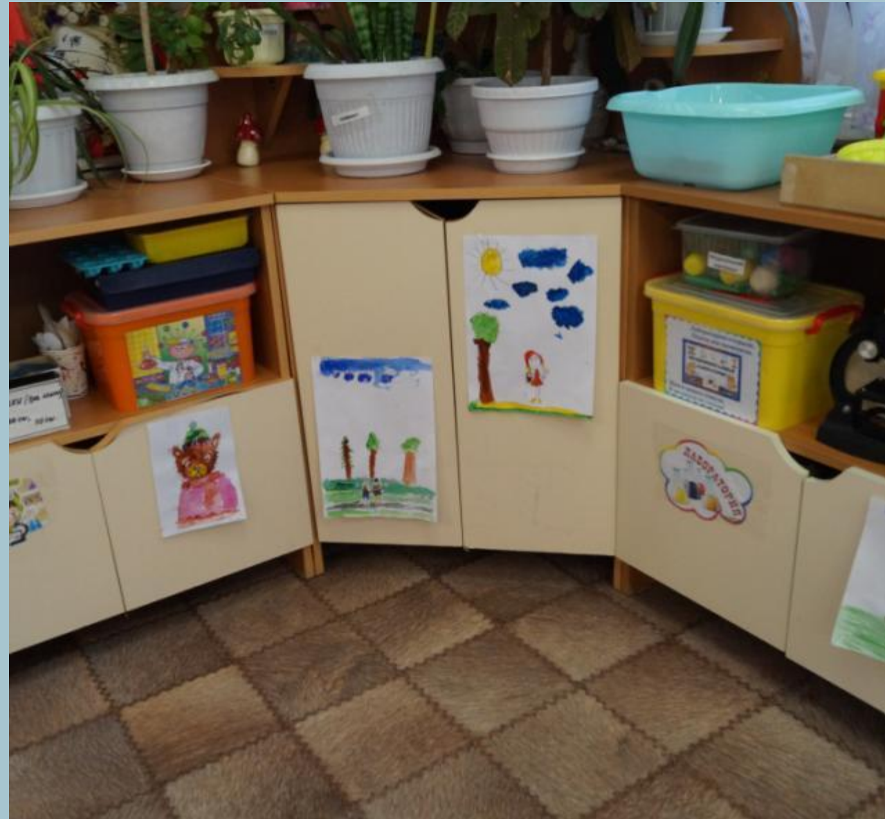
Экспериментирование и исследовательская деятельность