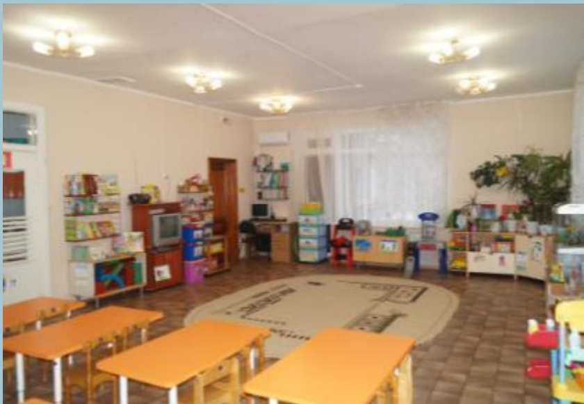
Вход в группу, нижняя левая точка