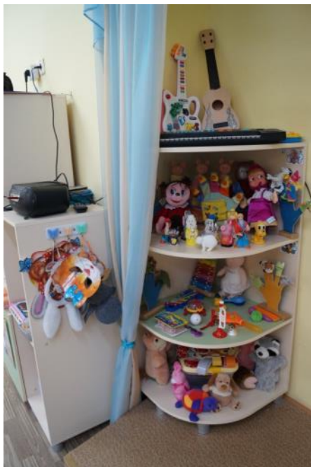
Музыкальный и театральный уголок

Гибкое зонирование в нашей группе позволило нам создать следующие уголки-центры: