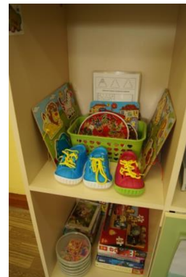
Уголок развития мелкой моторики