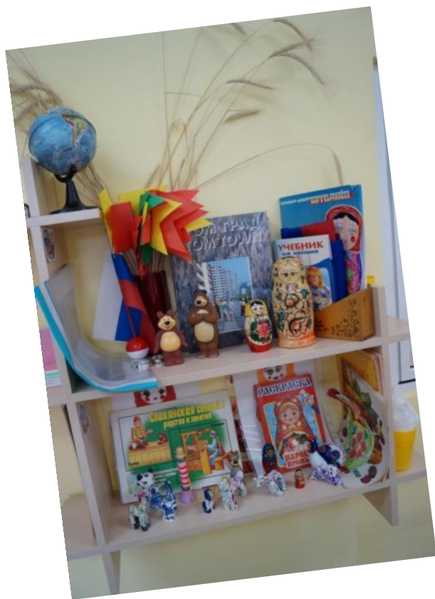
Патриотический уголок и уголок народного творчества