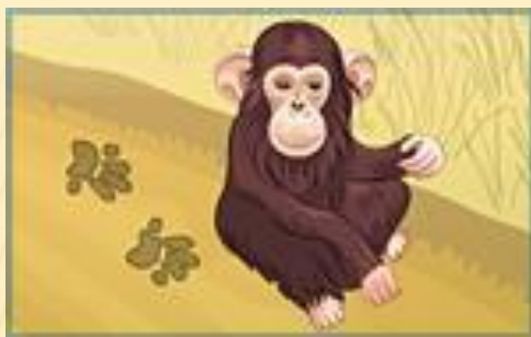
"Чьи следы?" Игра 2