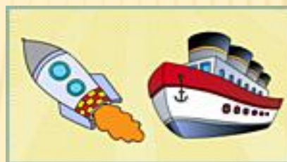
"Профессии" Игра 3