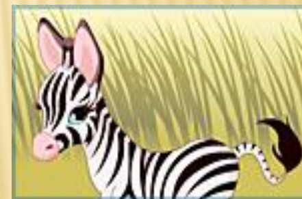
"Чей малыш?" Игра 2