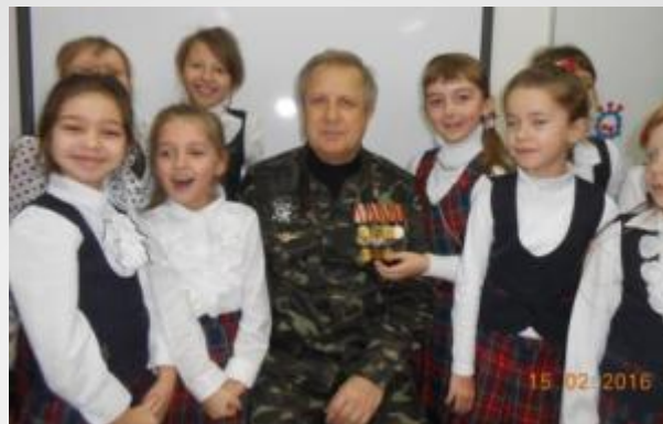
Тематические классные часы