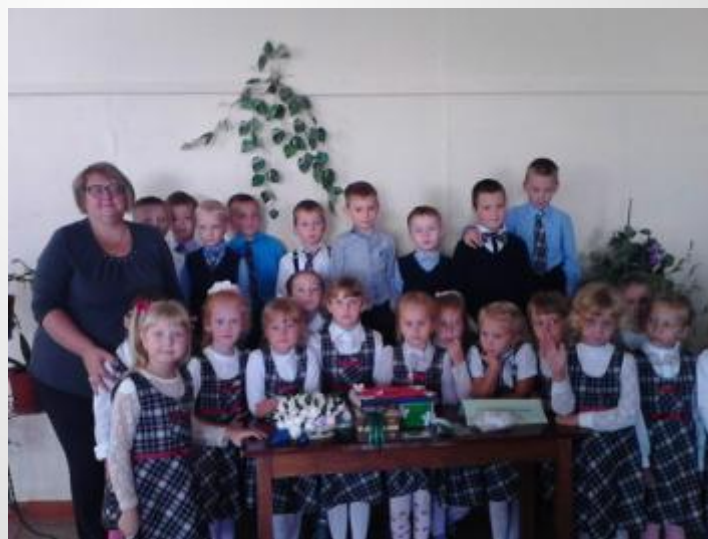
Благотворительная акция «Белый цветок»