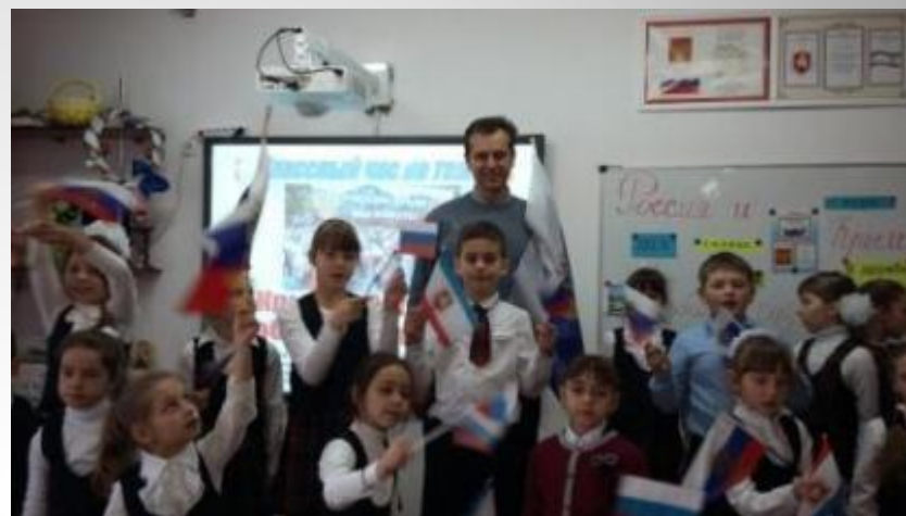
Единые классные часы