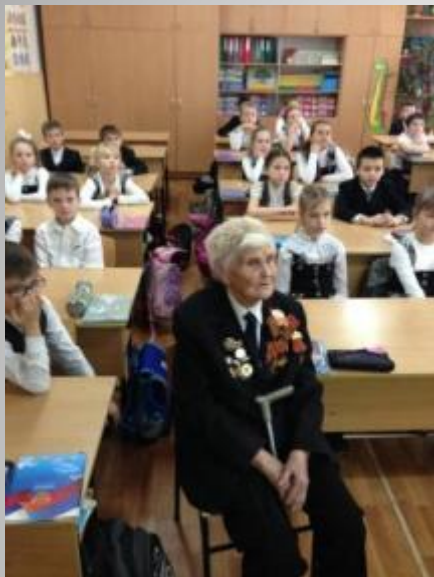
Встреча с ветеранами