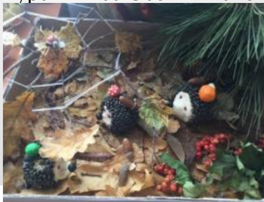
Конкурсы прикладного творчества