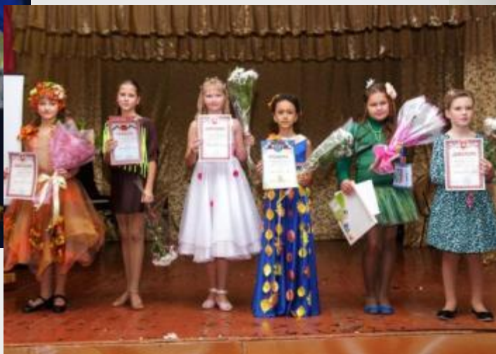
Конкурс «Мисс Осень - 2016»