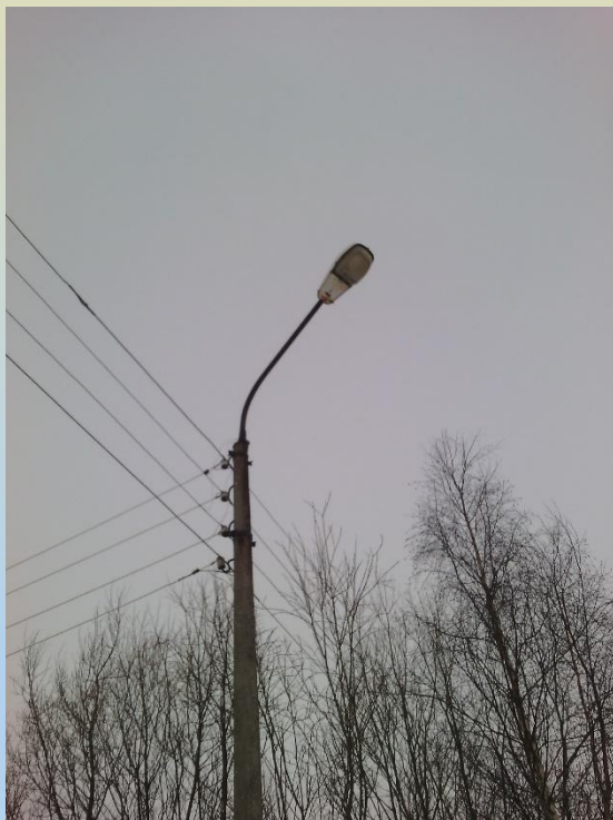
Общественная территория до выполнения работ