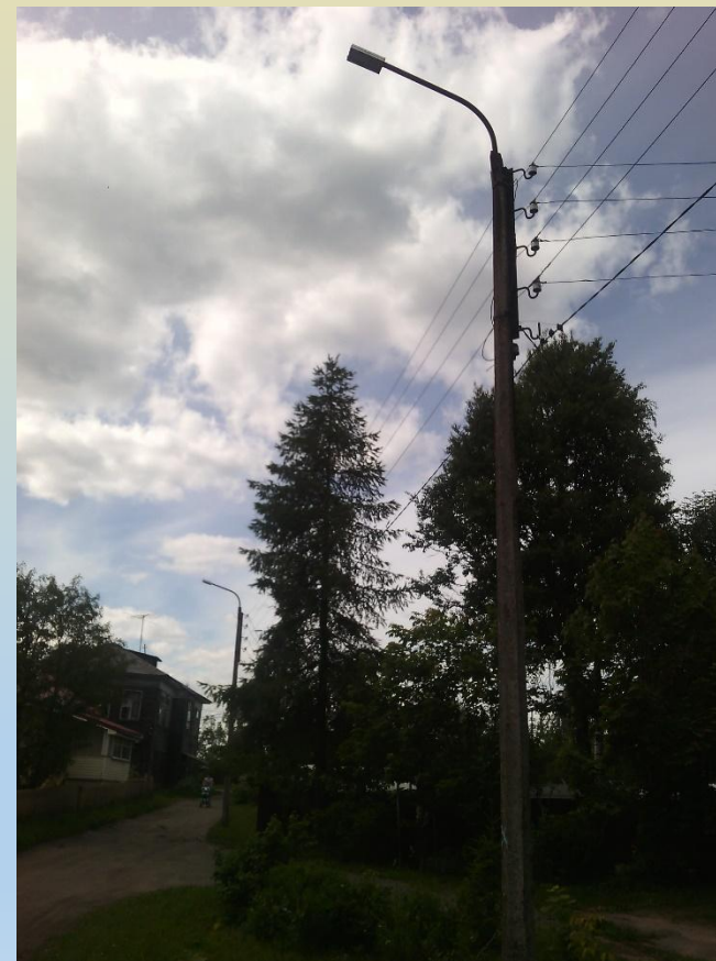
Общественная территория после выполнения работ