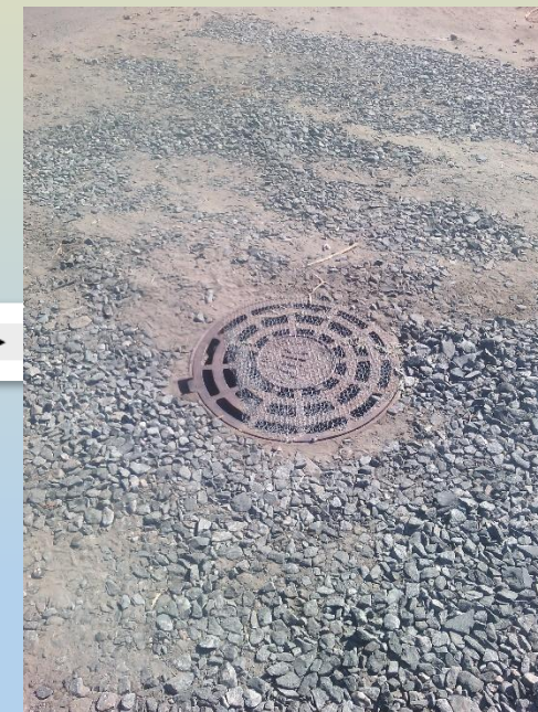
Общественная территория после выполнения работ