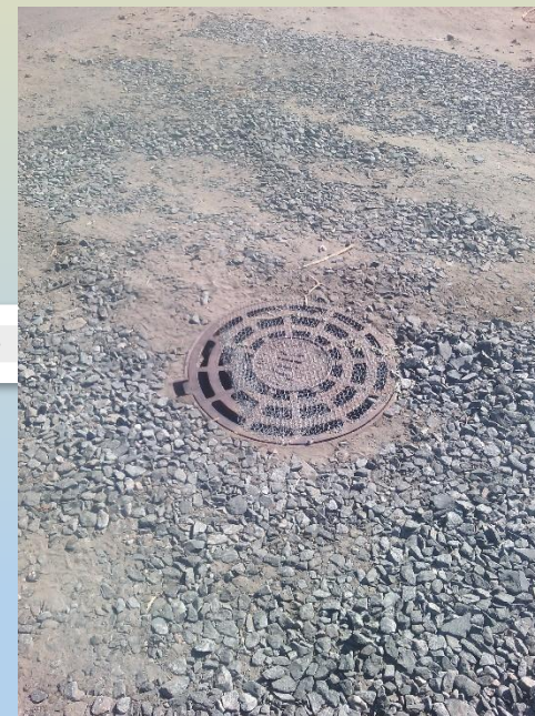
Общественная территория после выполнения работ