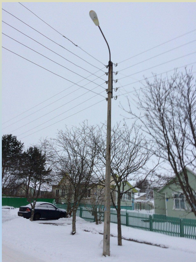
Общественная территория до выполнения работ