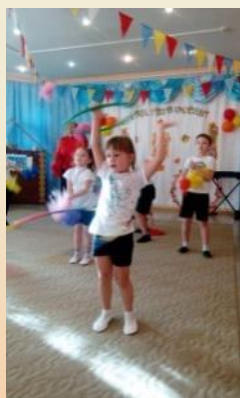
Хочу быть ловким, сильным и смелым