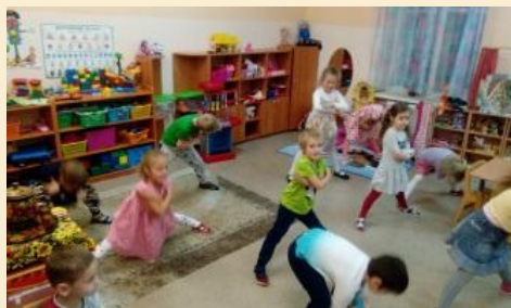
Утренняя гимнастика «Я тоже так могу, как..»