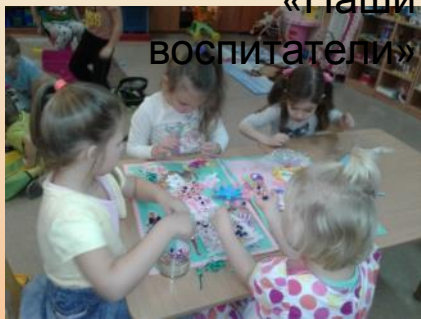
Коллективная работа коллаж «Наши воспитатели»