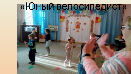
Танцевальные движения тематического Характера «Ты – мой друг»