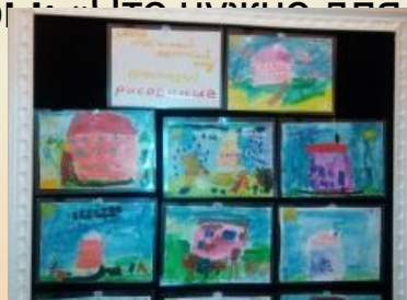
«Наш Детский сад»