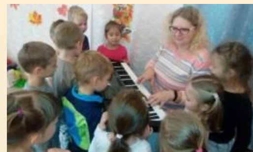
Игровая ситуация «Подбери мелодию для педагога»