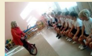
Знакомство с реквизитом циркового искусства «Наш инструктор по физ. культуре – это...»