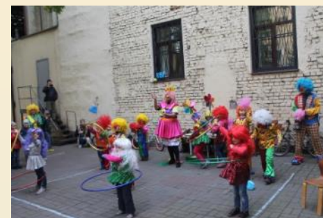
Мы несем радость – выступление ребят на районном конкурсе