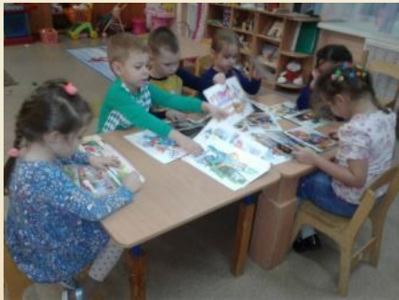
Рассматривание иллюстраций в тематических книжках

Составление описательного рассказа о людях разных профессий с опорой на картинку: «Все работы хороши», составление рассказа: «Кем работают мои родители.»