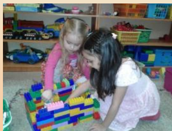
Конструктивно- модельная деятельность «Дома на нашей улице»