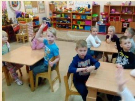
Обсуждение сказки К. Чуковского «Айболит»