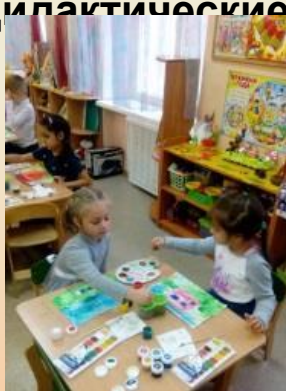
Предметное рисование «Мой Детский сад»

Конструктивно-модельная деятельность «Дома на нашей улице»