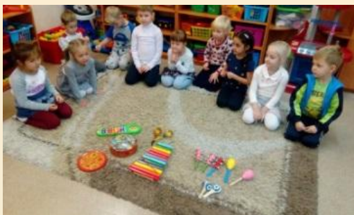
Игровая ситуация «Педагоги детского сада говорят как...»