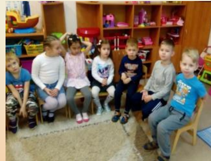
Составление рассказа «Кем работают мои родители»