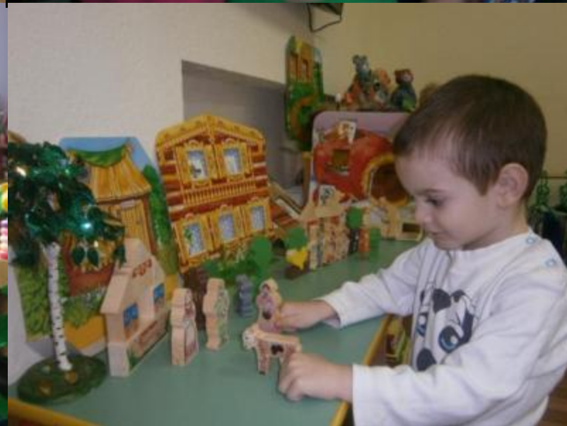
Знакомим детей русскими фольклором