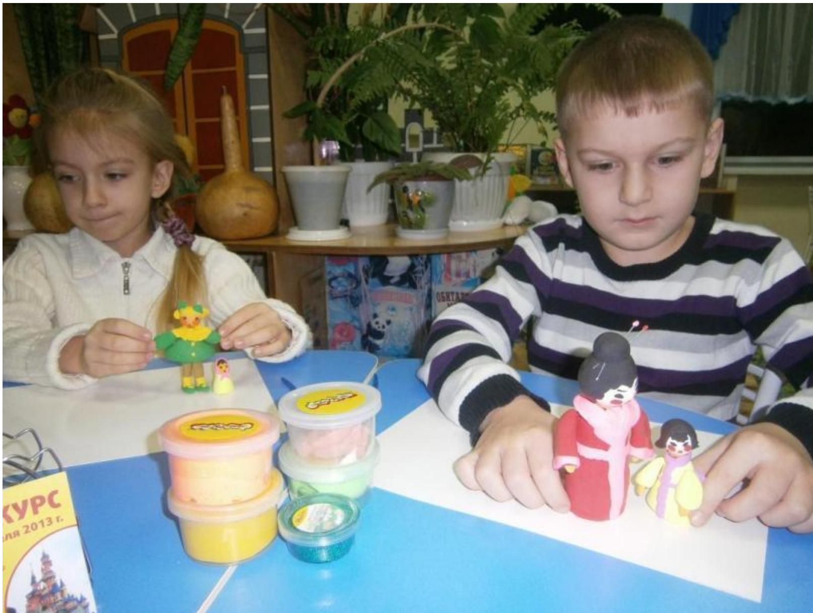
«Мамы и дети разных стран – лепка»