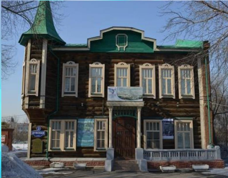
Музей Алексея Николаевича Либерова