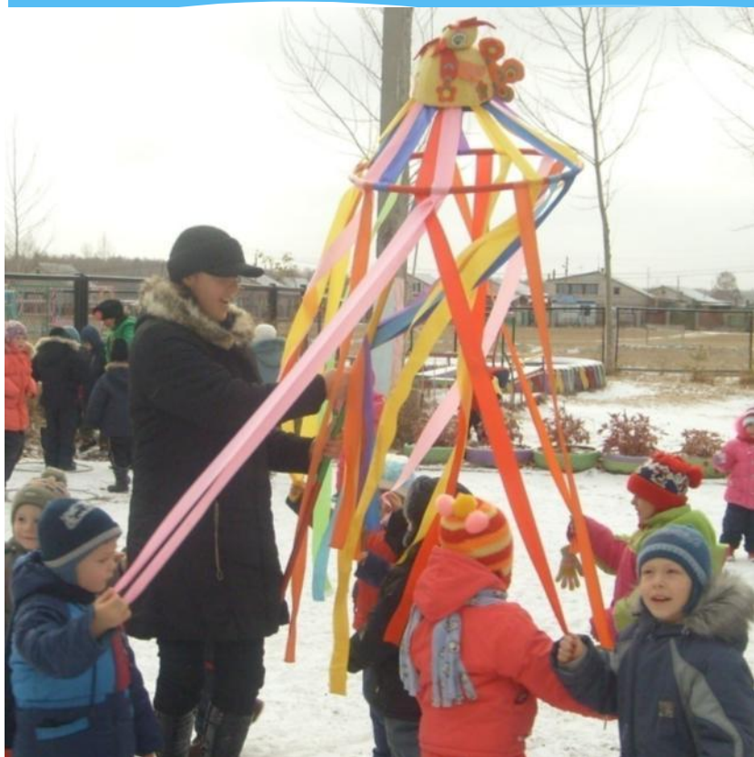
Фестиваль народных игр Южного Урала