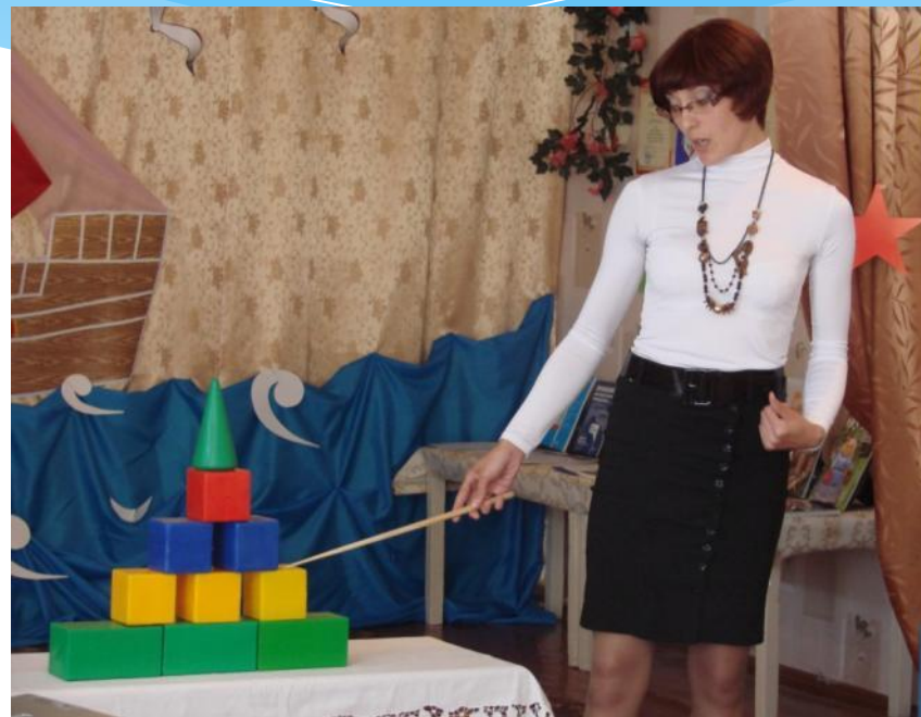
Творческие самопрезентации младших воспитателей