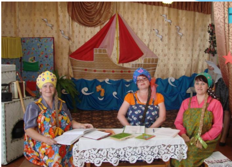
Интерактивное представление ППО работы воспитателями ДОУ