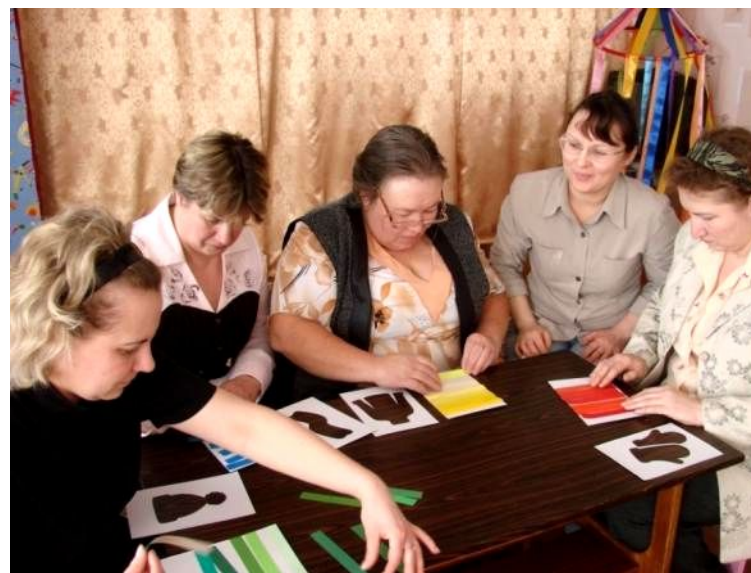
Работа в творческих микрогруппах