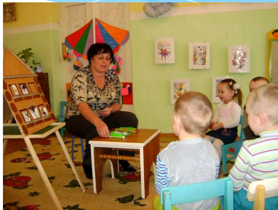
Играем в музыкально- дидактические игры