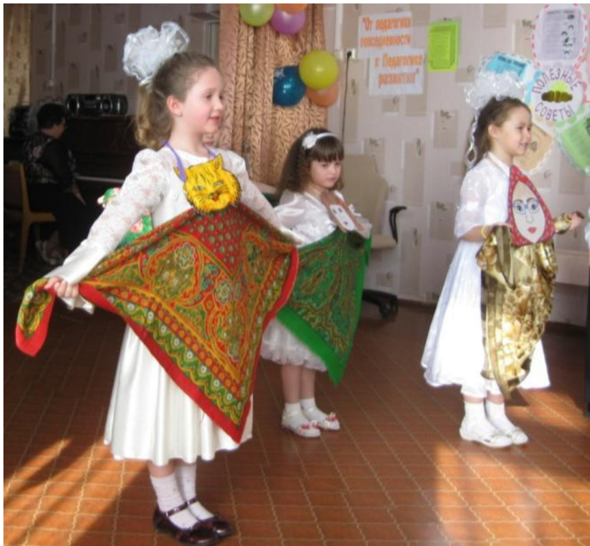
Театр «живой руки»