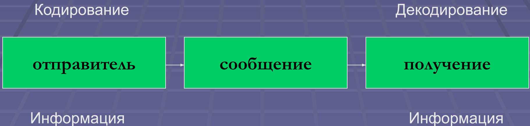
Схема отдельного коммуникативного акта