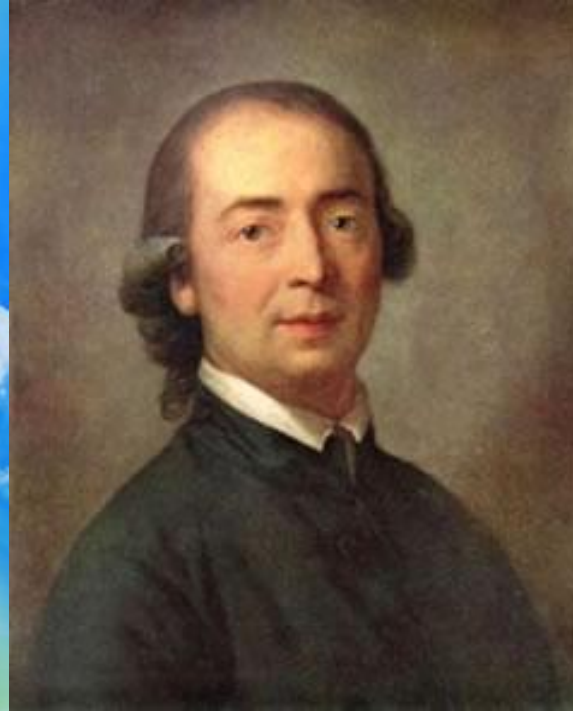
Гердер Иоганн Готфрид (25.8.1744 — 18.12.1803), немецкий философ, писатель-просветитель.