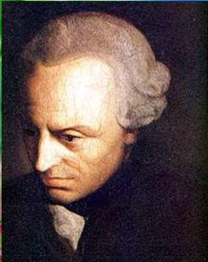
Имману́ил Кант 22 апреля 1724— 12 февраля 1804 — немецкий философ.

И. Кант подходит к культуре как субъективному состоянию личности и проводит различие между культурой умения (как цивилизованностью) и культурой воспитания (как нравственностью).