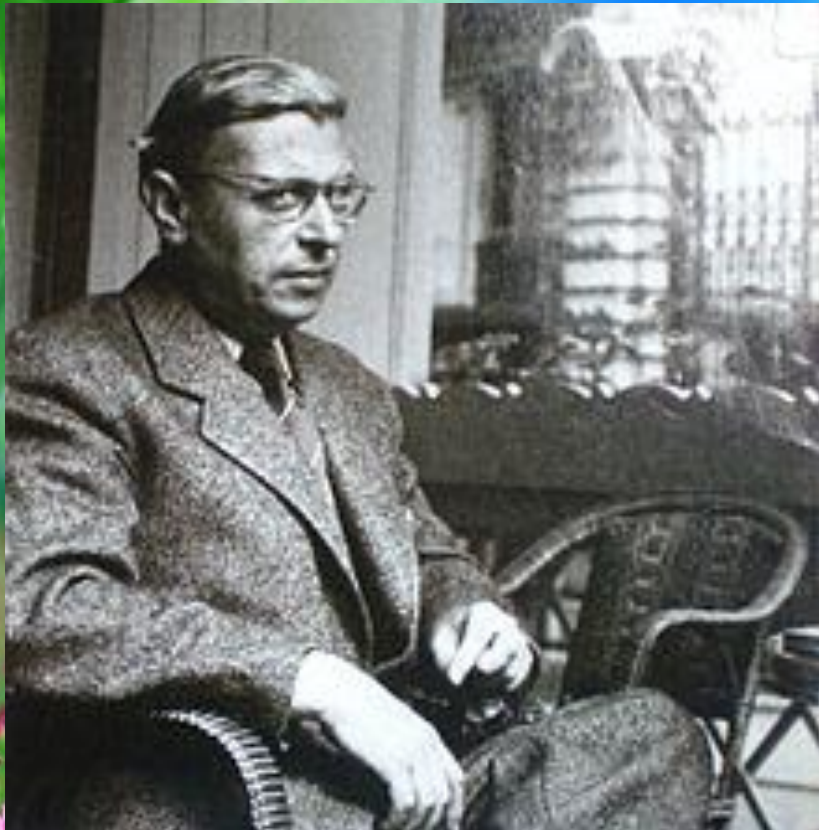
Жан-Поль Шарль Эма́р Сартр 21 июня 1905 — 15 апреля 1980 — французский философ, писатель, драматург.

Со второй половины XIX в. понятие «культура» постепенно приобретает статус научной (а не только философской) категории. В XX в. как отмечал Ж- П. Сартр, культура никого и ничего не спасает и не оправдывает. Но она — дело рук человека, в ней он ищет свое отражение, в ней он узнает себя, только в этом критическом зеркале он может увидеть свое лицо