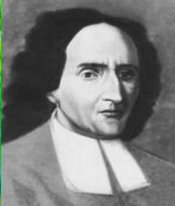
Вико Джамбаттиста (23.6.1668 — 21.1.1744), итальянский философ.

Понятие «культура» в его современном значении начало применяться в Европе в XVIII в. благодаря работам таких мыслителей, как Дж. Вико, И. Г. Гердер, Ш. Монтескье.