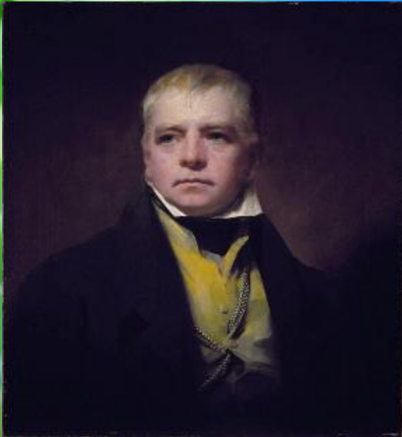
ВАЛЬТЕР СКОТТ 15.08.1771 - 21.09.1832 -английский поэт, -прозаик, историк.

Понятие культуры становится одним из центральных в философии. В сочинениях Вольтера, Тюрго, Кондорсе, Вико культура предстает как результат поступательного развития истории и степень воплощения разумного начала, реализованного в религии, философии, науке, праве, морали как объективациях разума. Цель культуры, соответствующая высшему назначению "разума" - сделать людей счастливыми, живущими в согласии с потребностями своей "естественной" природы.