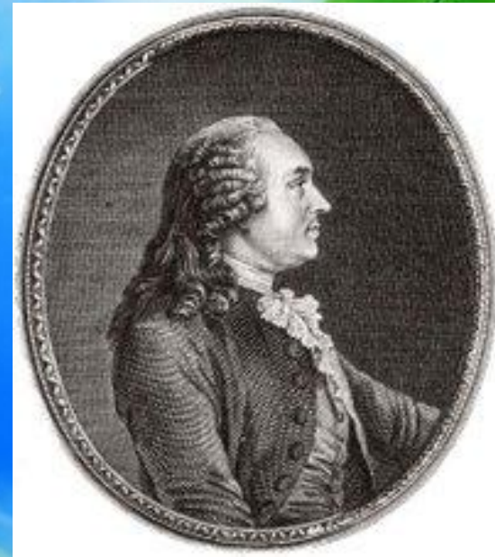
Анн Робер Жак Тюрго 10 мая 1727— 18 марта 1781)