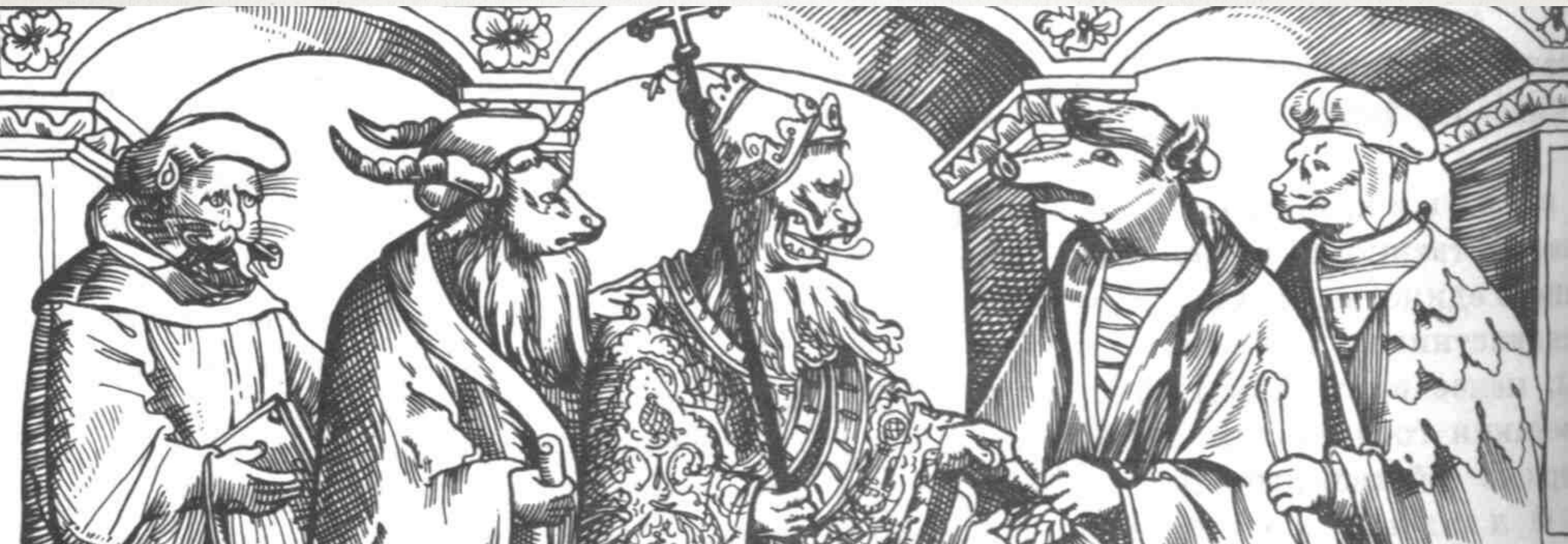
Папа Римский и церковнослужители. Карикатура 16 в.