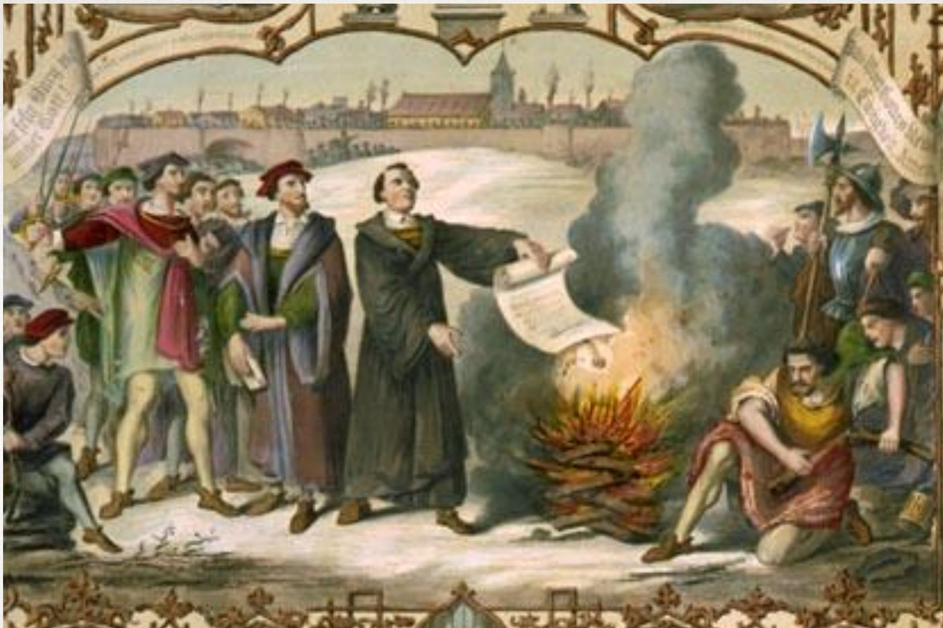
Мартин Лютер сжигает буллу об отлучении