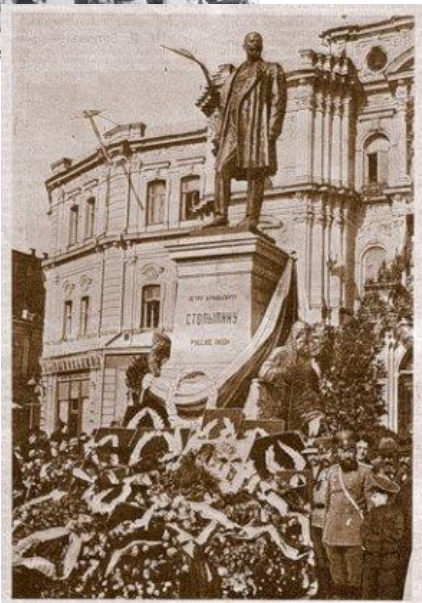
Открытие памятника покойному премьер-министру России П. А. Столыпину в г. Киеве, 8 сентября 1911 г. Памятник высотой 12 метров. Скульптор Александр Андрусовский. Проект памятника выполнил архитектор Михаил (русская школа) и Сербия (русская школа). Памятник возмущает не только Киев, но и Харьков, где тоже горюет армия. Все сооружение обошлось в 120 тыс. руб. На открытии памятника съездили министры, члены Гос. Совета и Гос. Думы разных политических фракций, многочисленные депутаты и высшие армейские чины. Через два дня, 7 сентября, состоялось заседание президиума Столыпинского Вече, где была учреждена комиссия П. А. Столыпина.