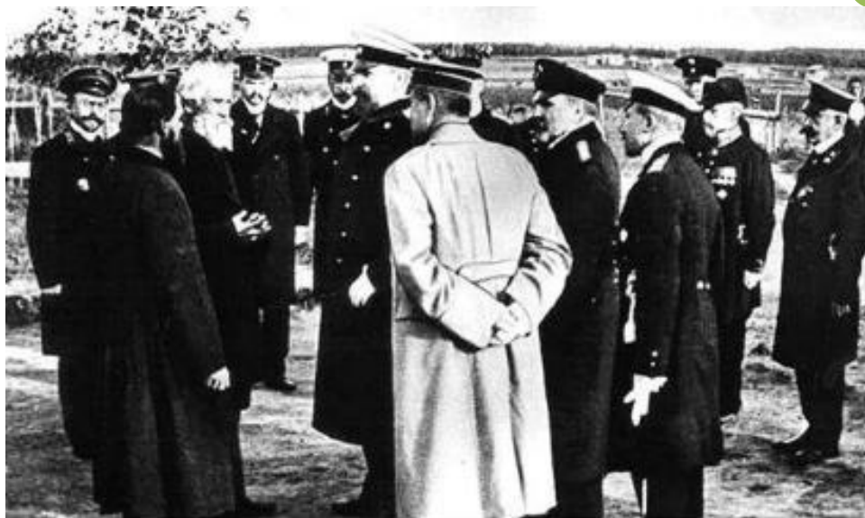
П Столыпин в гостях у кулака.

● Это вновь привело к началу промышленного подъема (1909-13 гг. - 9% в год). Крестьянство пошло по своему пути в отличие от американцев оно стало объединяться в кооперативы , которые активно работали как на внутреннем, так и на внешнем рынке. В 1912г. был создан Московский народный банк кредитовавший