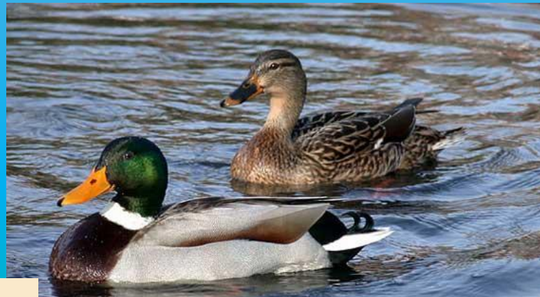
Природный заказник «Долина р. Сетунь»