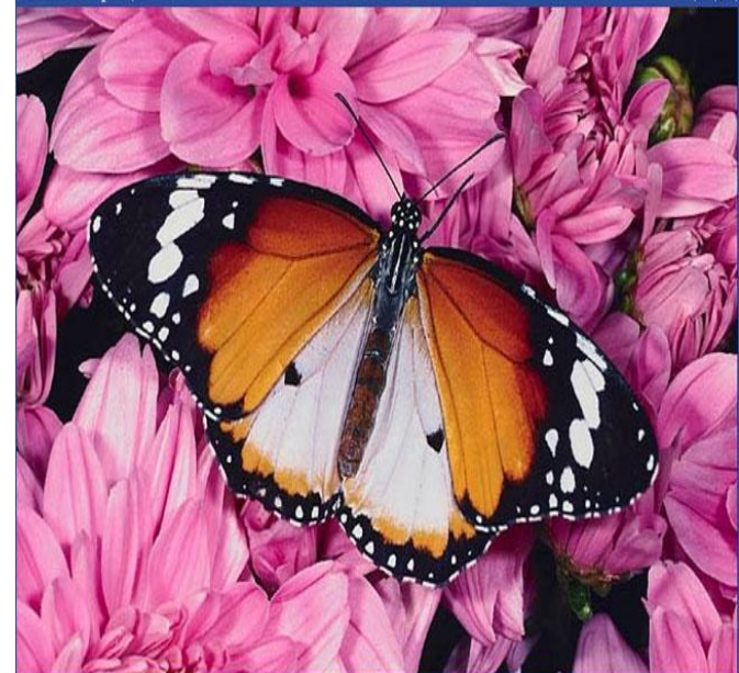
Бабочка семейства данаид ( Danaus genutia ).