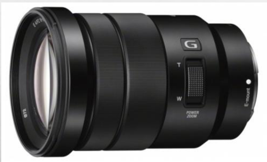
SONY 18-105 F4 G OSS