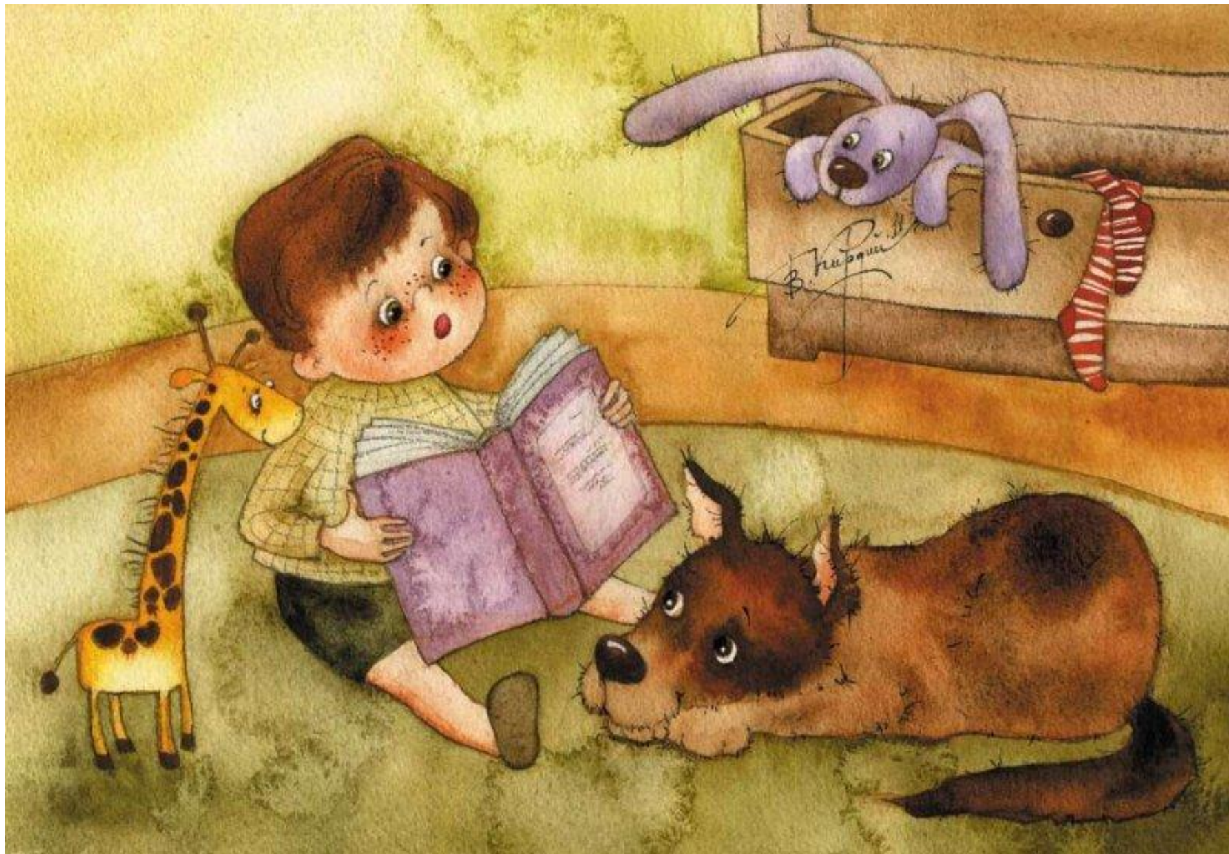
Знакомство ребенка с художественной литературой