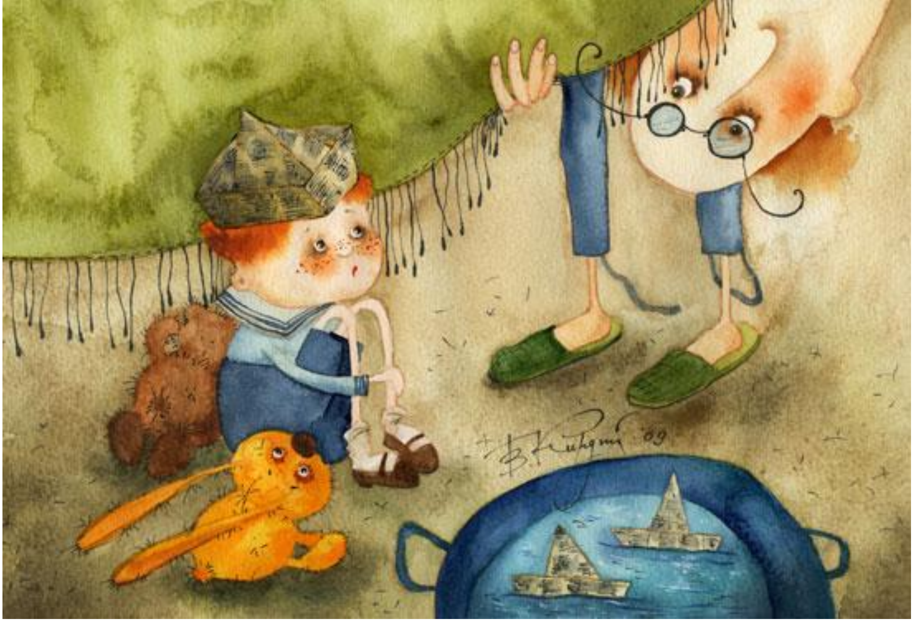
Появление первых страхов