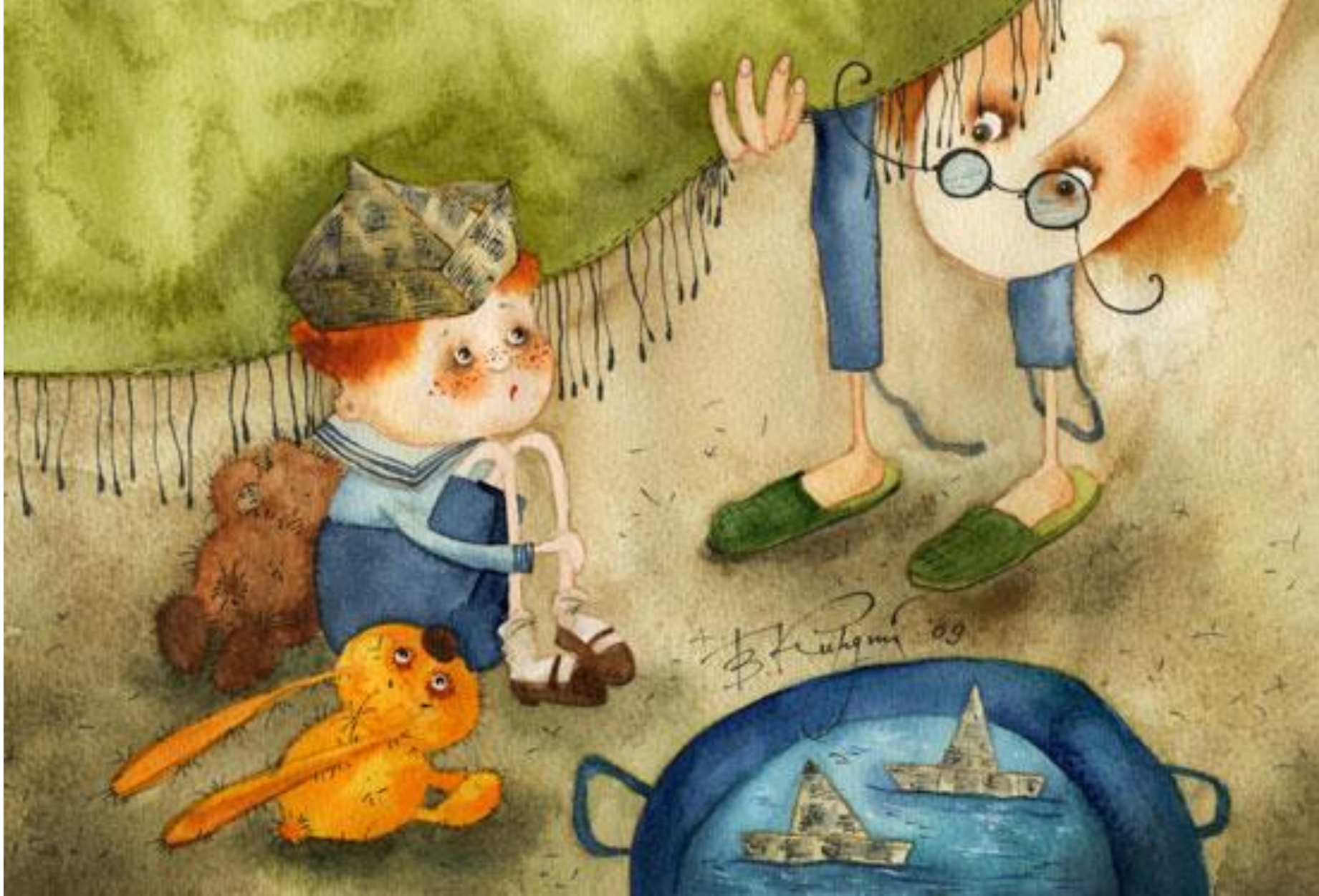
Появление первых страхов