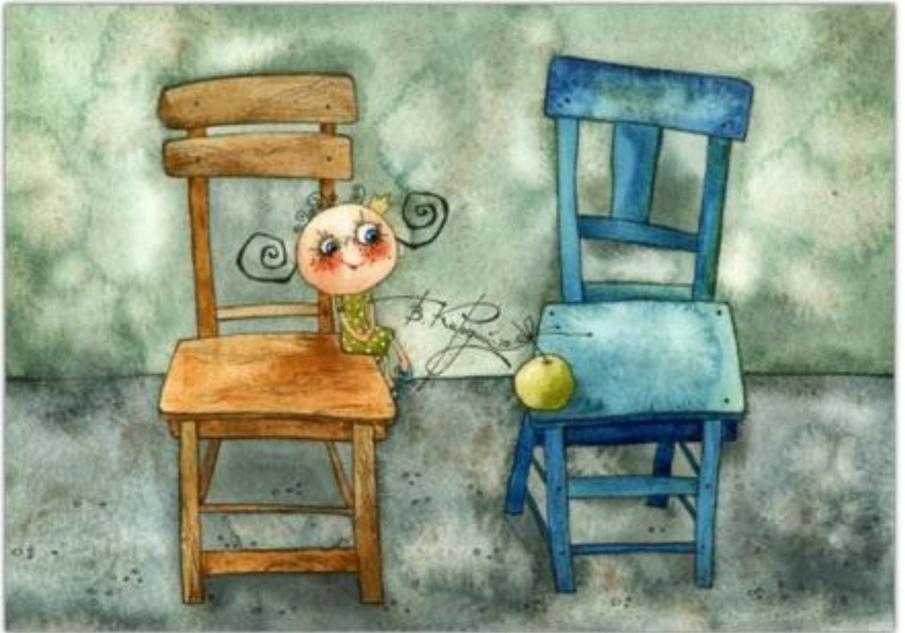
Новое незнакомое помещение и обстановка