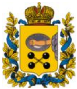
герб Олонецкой губернии