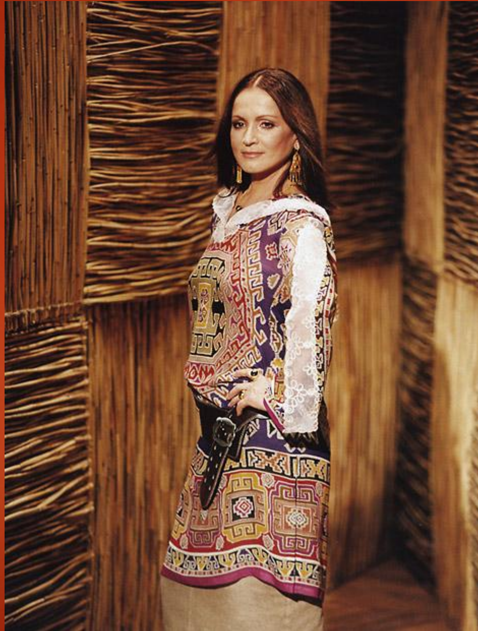
София Ротару- певица