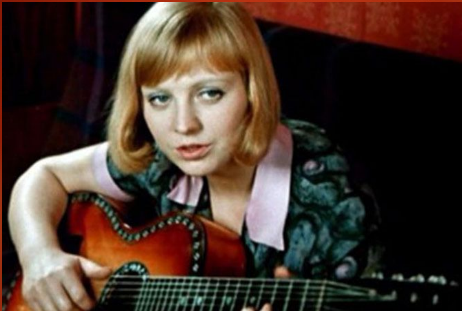
Светлана Крючкова- актриса