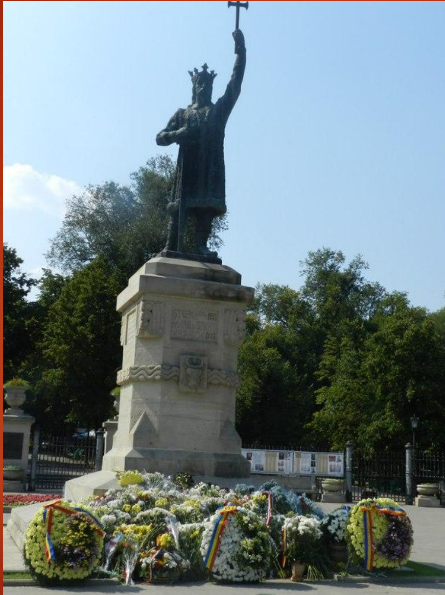
Памятник Штефану Великому в Кишинёве (1928)