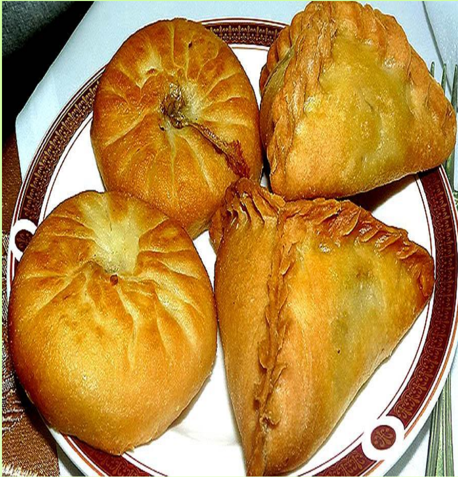
Эч-почмак и бэлэш