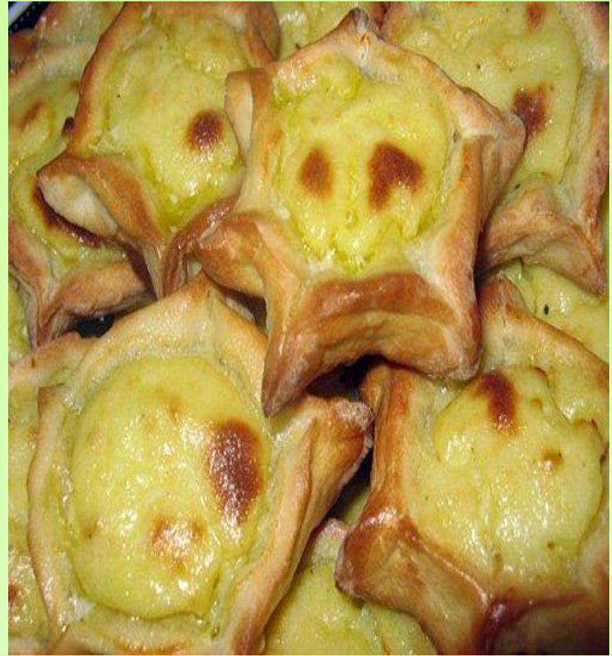
Шаньги с картофелем