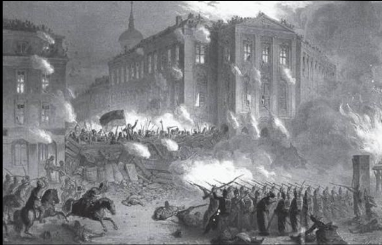
Бої в Берлине (1848 г.)

Головною політичною вимогою став заклик до скликання всенімецьких Установчих зборів. Улітку 1848 р. відбулися вибори до всенімецьких Установчих зборів, які отримали назву Франкфуртський парламент .