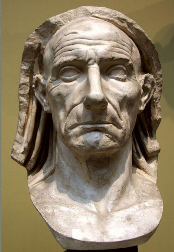
Голова старика в покрывале в музее Кьярамонти в Ватикане (староримское направление)