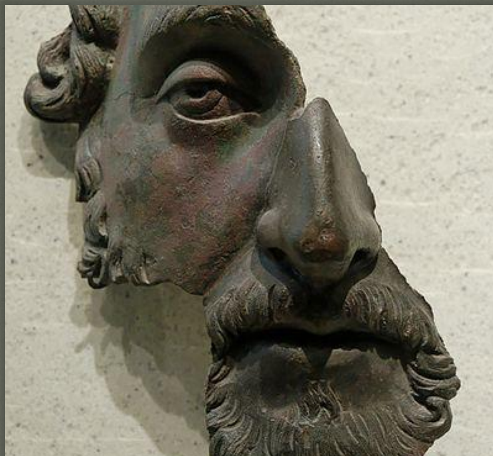
Император Марк Аврелий. Бронза, фрагмент