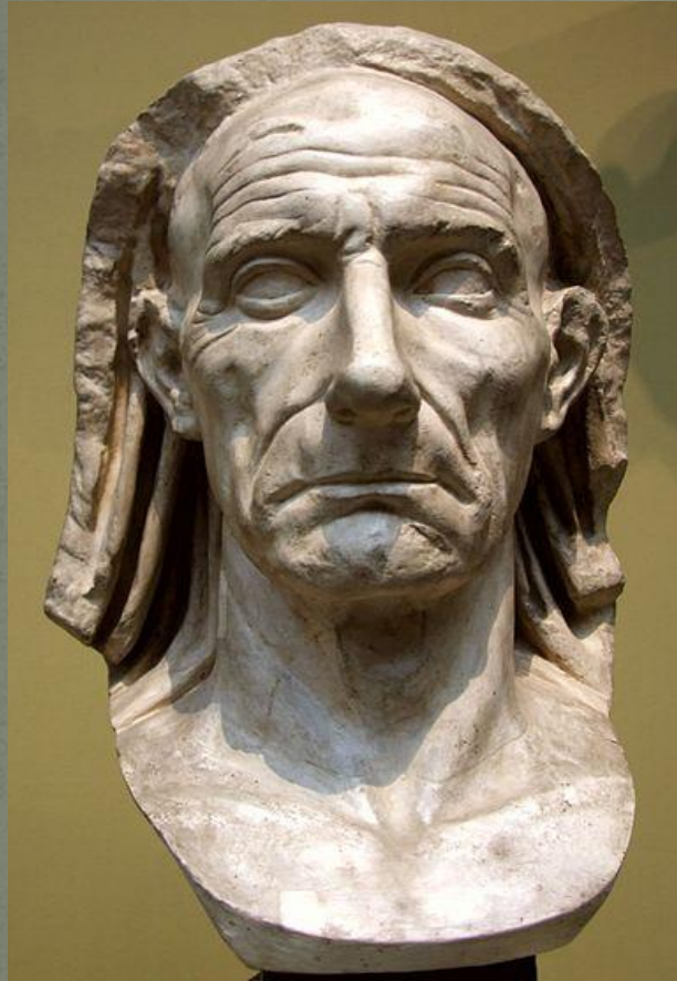
Голова старика в покрывале в музее Кьярамонти в Ватикане (староримское направление)