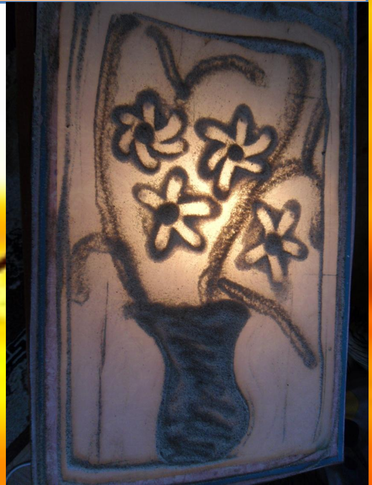
Батура Вика «Букет»