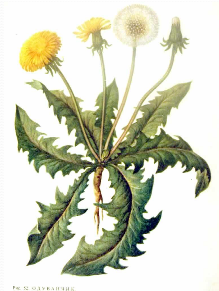
Рис. 52. ОДУВАНЧИК

Многолетнее травянистое растение. У него желтые цветки и семена с пушистыми волосками, которые разносятся ветром. Растет вдоль дорог, у жилья. 200 видов.