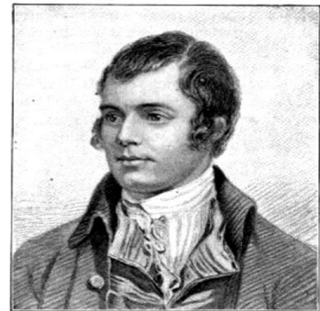
From the painting by Naemyth, National Portrait Gallery.