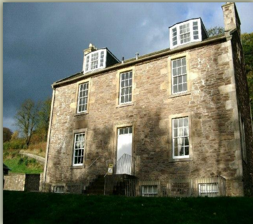
Дом Роберта Оуэна в Нью-Ланарке