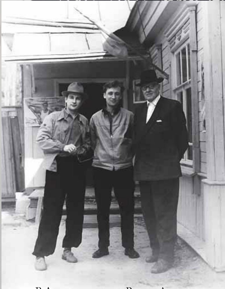
В Доме творчества «Руза» с А. Эшпаем и Ю. Шапориным