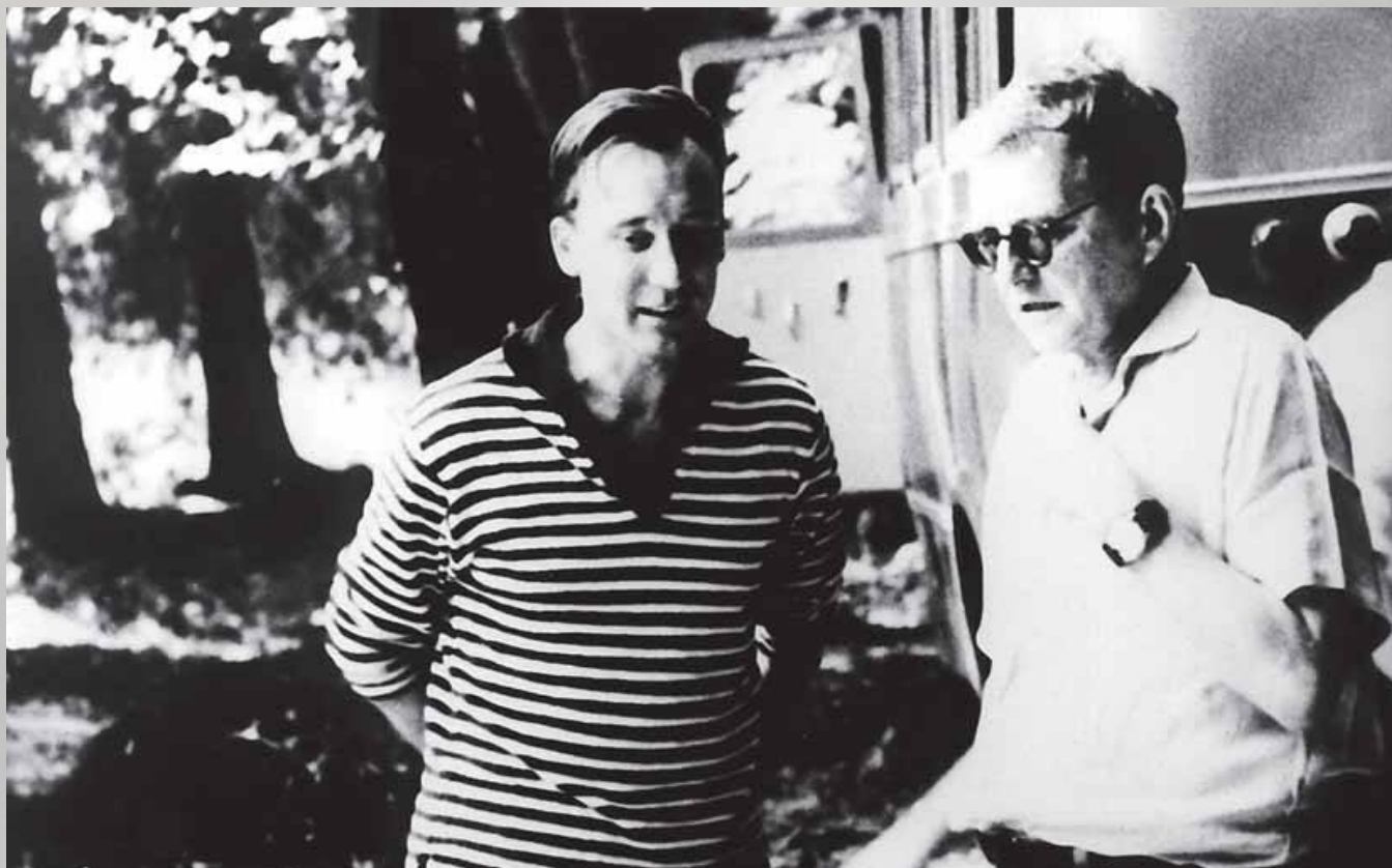
С Дмитрием Шостаковичем. Дилижан, 1964 год