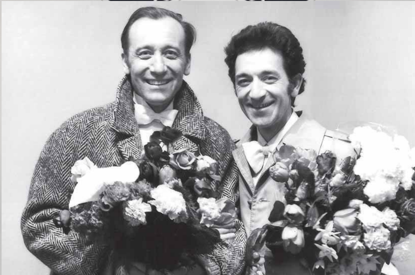
После премьеры оперы «Мертвые души» в Большом театре с Юрием Темиркановым. 1977 год