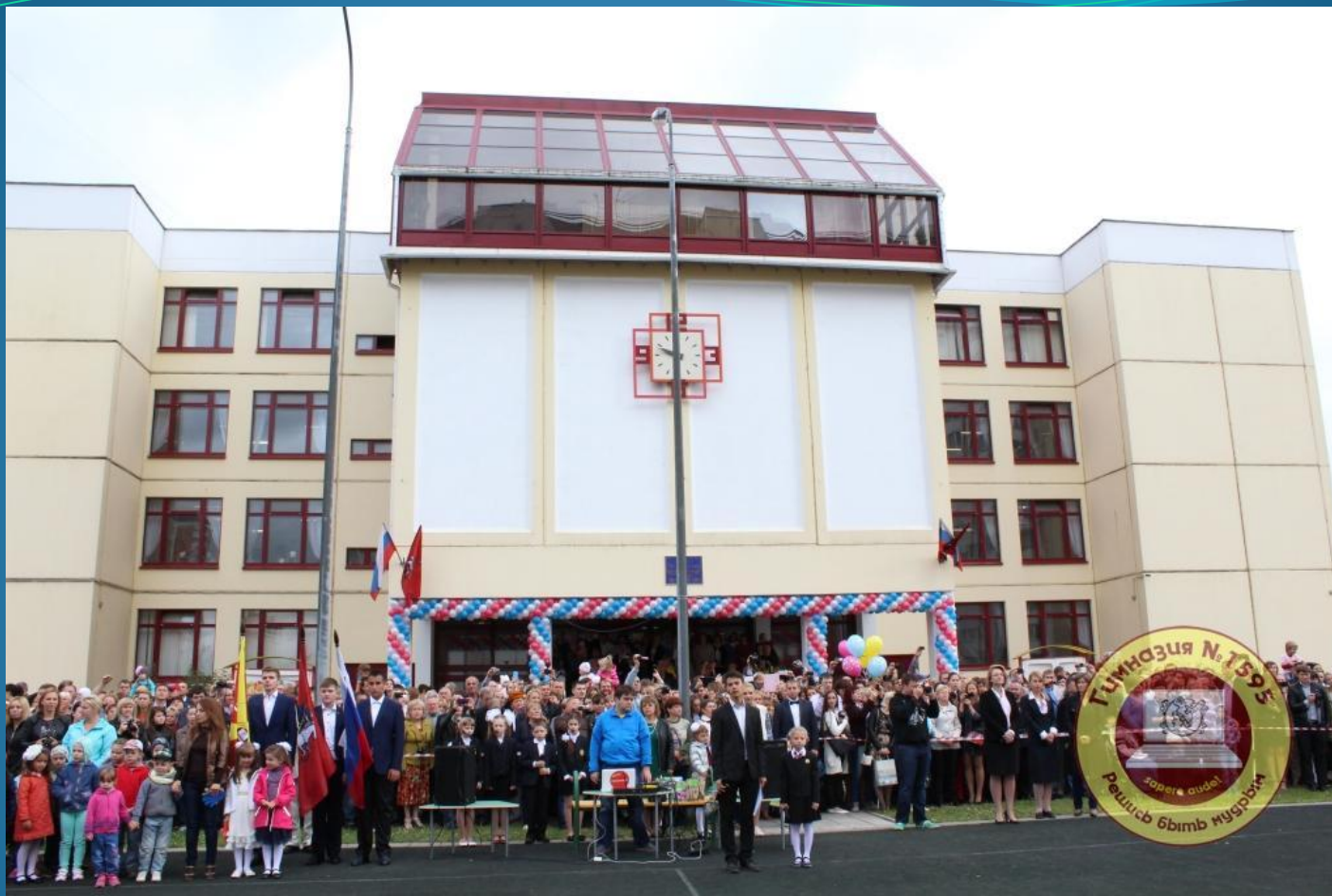
ГБОУ Гимназия 1595 ДОШКОЛЬНОЕ ОТДЕЛЕНИЕ