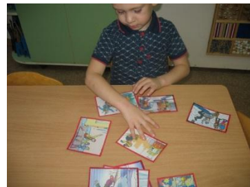
Кармашек «Это опасно зимой!»