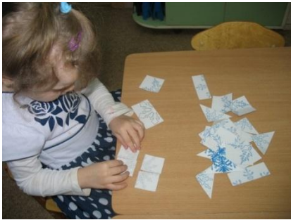
Разрезные картинки «Собери свою снежинку»