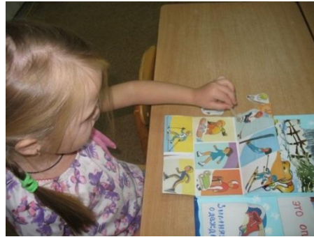
Раскладушка «Зимние виды спорта»