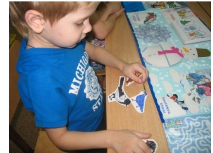
Кармашек «Зимующие птицы»