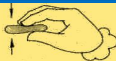
а) маленький кусок