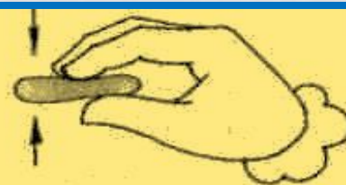
а) маленький кусок