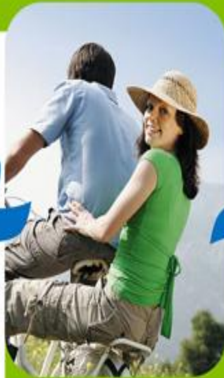
Активный образ жизни