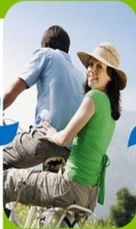
Активный образ жизни