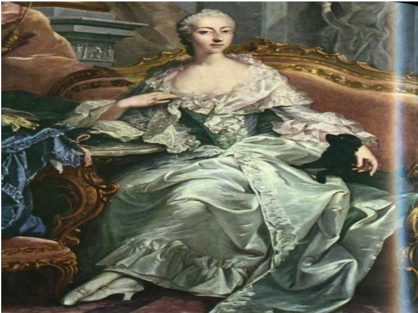
Чешская аристократка, одетая по моде рококо.