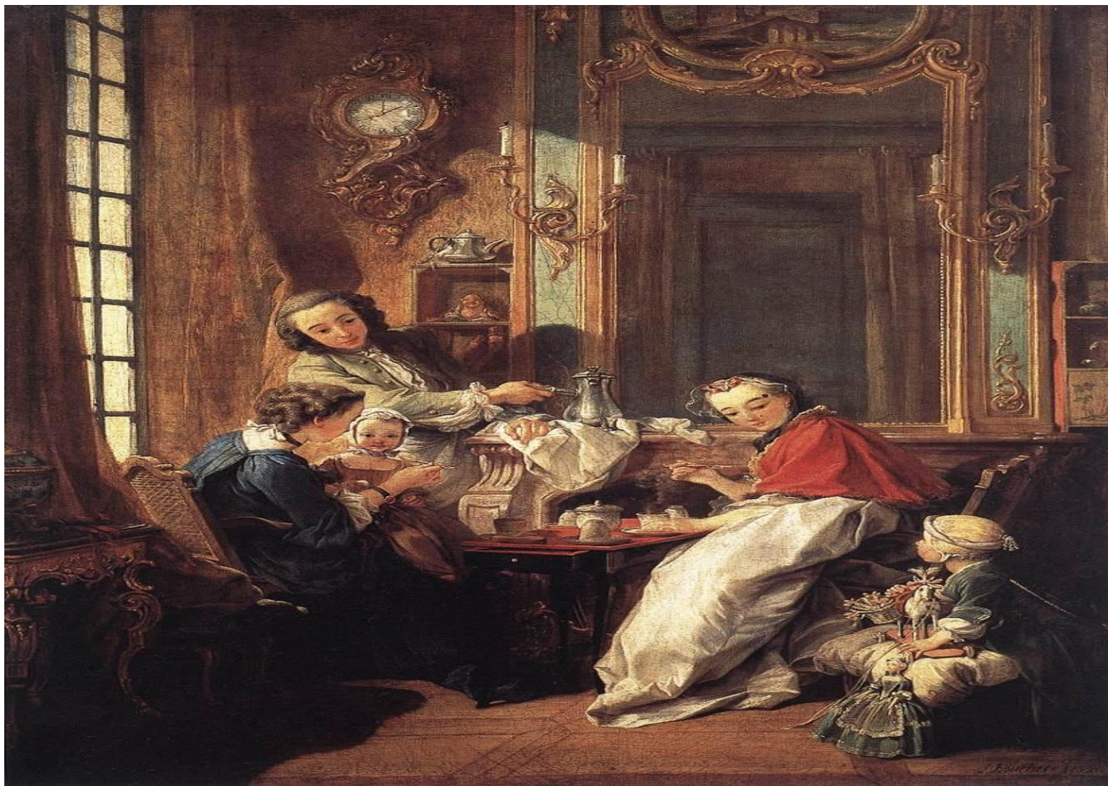
Франсуа Буше. «Завтрак» (1739).