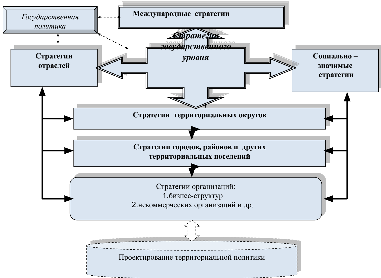
Схема взаимосвязи стратегических решений при проектировании территориальной политики