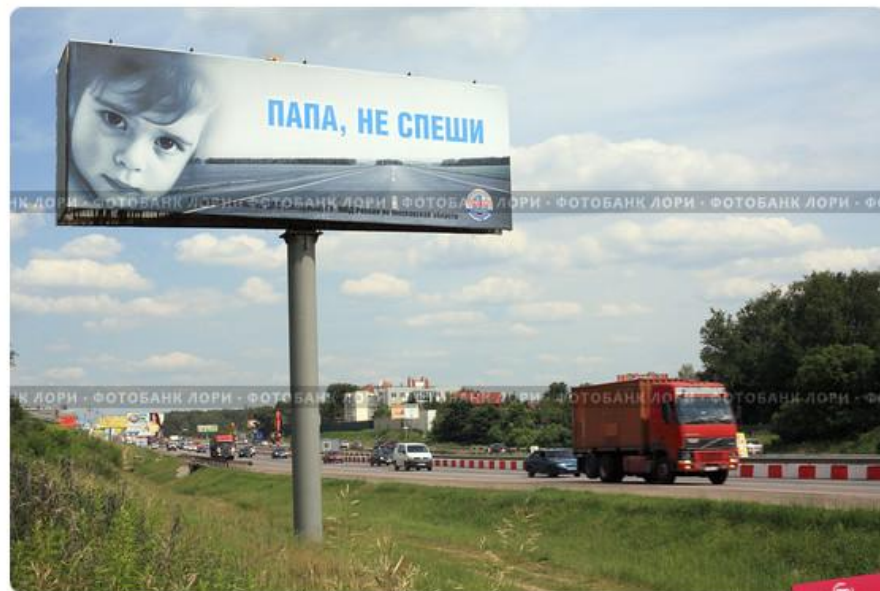
Социальная реклама с лозунгом "Папа, не спеши"