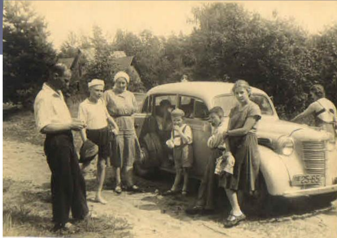
Выезд семьи на дачу. 1950 г.