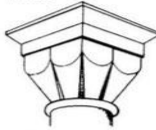
Капитель в виде трубок или складок