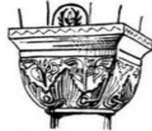
Капитель с гальметтами