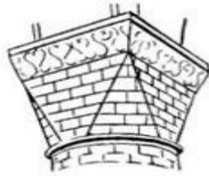
Кирпичная кубическая капитель