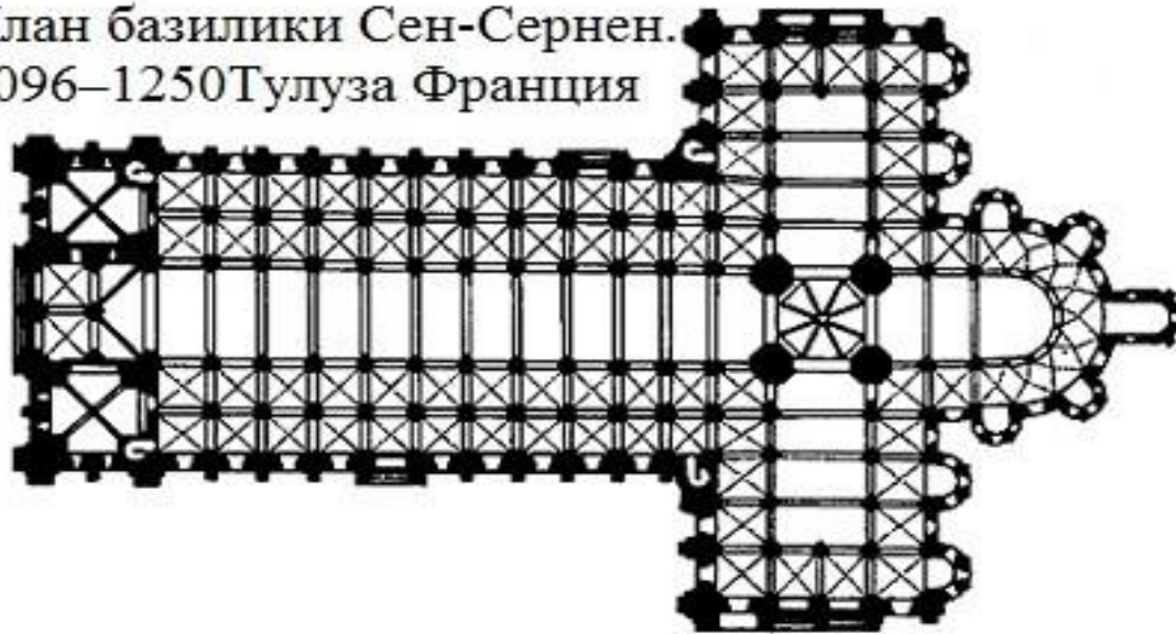
План базилики Сен-Сернен. 1096–1250 Тулуза Франция