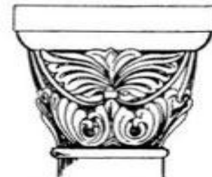
Чашевидная блочная капитель