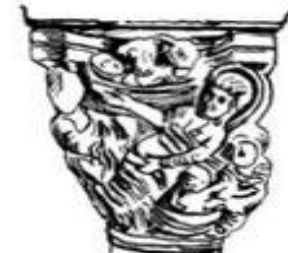
Капитель с изображением фигур людей