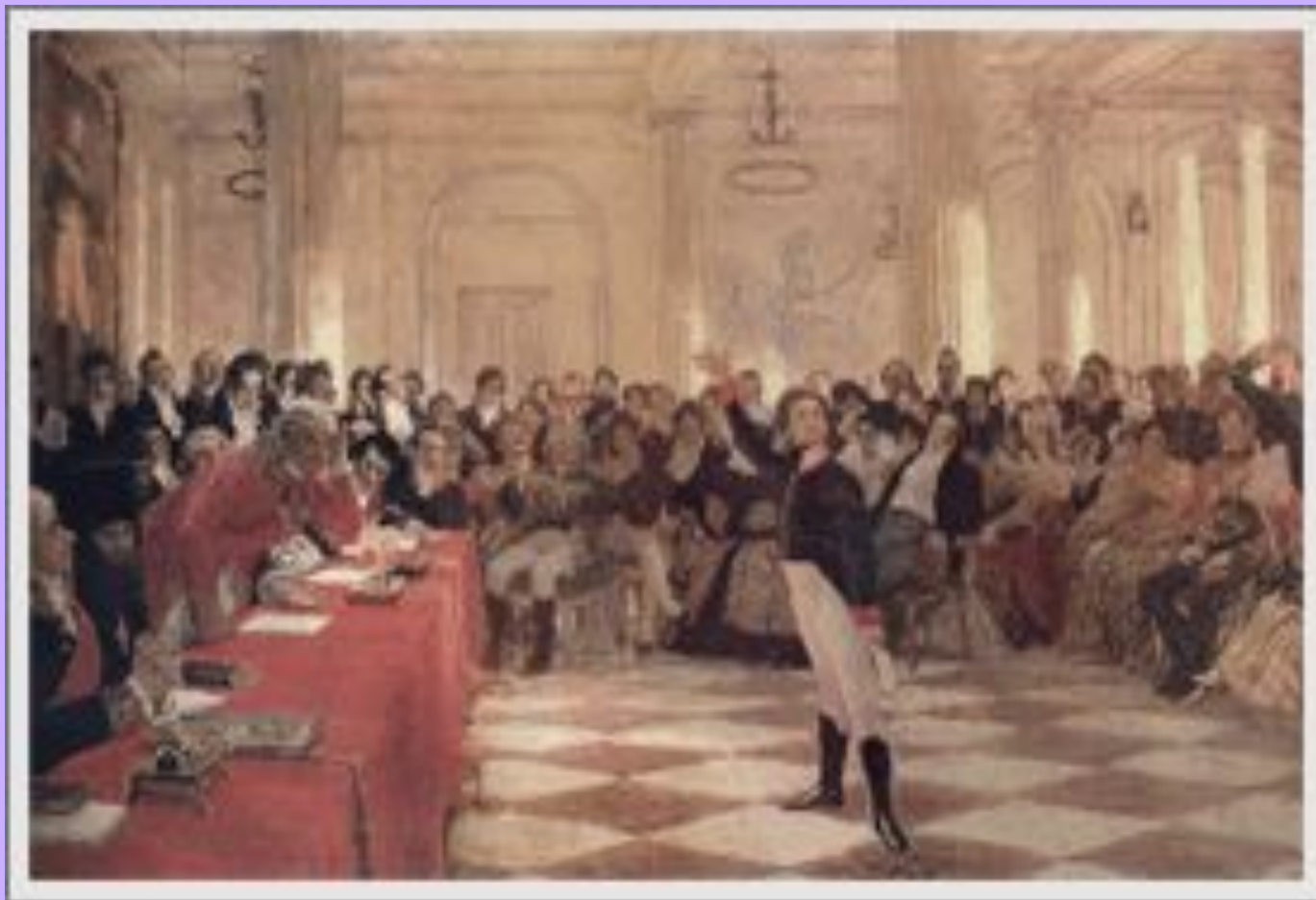
И.Е. Репин. Пушкин на лицейском акте. Холст, масло. 1911. (ВМТТ)