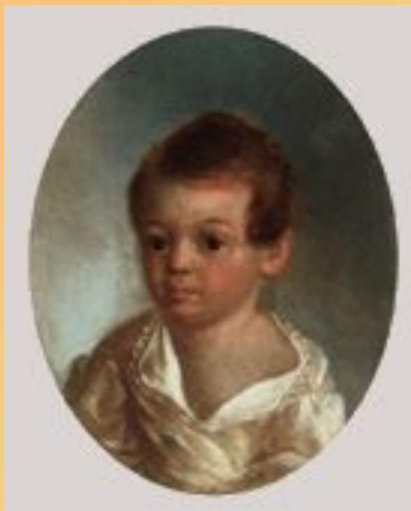
К. де Местр(?). Пушкин-ребенок. Метал. пласт., масло. 1801-1802. (ГМТ)

Детские годы Пушкина протекли в Москве и подмосковном селе Захарове.