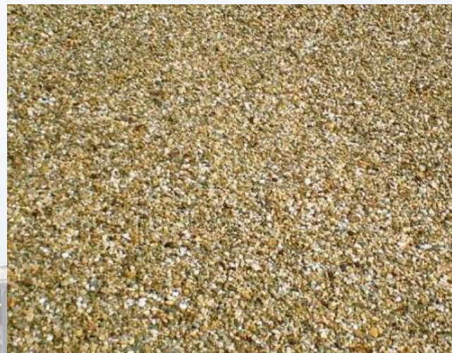
ОТСЕВ, содержание гравия 50%, мелкий Речная смесь песка и гравия, размер гравия 0-5 мм, содержание гравия 50%, песка 50%