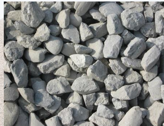
ЩЕБЕНЬ, фракция 40-70

Смесь угловатых каменных обломков размером от 20 до 40 мм. Изготавливается из природного каменного материала