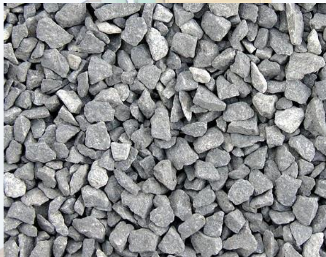
ЩЕБЕНЬ, фракция 20-40

Смесь угловатых каменных обломков размером от 5 до 20 мм. Изготавливается из природного каменного материала