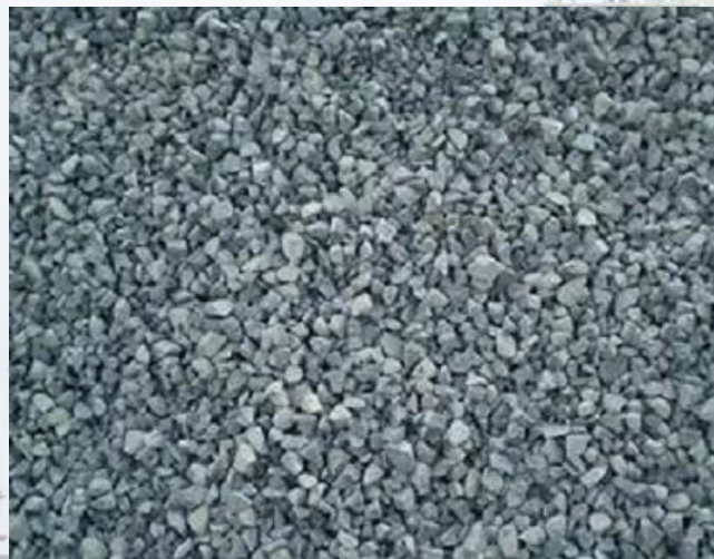
ЩЕБЕНЬ, фракция 5-20

Применяется для устройства дорожных покрытий, дренажей, приготовления цементобетона