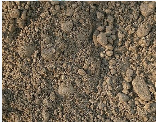
ОПГС, содержание гравия до 60% Речная смесь песка и гравия, размер гравия 20-120 мм, содержание гравия 60%, песка 40%