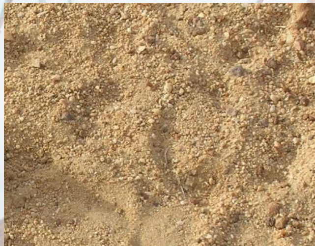
ПГС, содержание гравия до 30% Речная смесь песка и гравия, размер гравия 20-40 мм, содержание гравия до 30%, песка 70%

Применяется для приготовления бетона, заливки фундаментов, толстостенных и тонкостенных объектов, отсыпка на дорогу в виде подушки, для заливки полов, отмостки