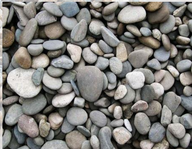
ГРАВИЙ, фракция 5-20 Мытая речная галька, размер гальки 5-20 мм

Применяется для изготовления легких бетонов и для последующего создания бетонных и железобетонных конструкций. Применяется в декоративных целях, для систем дренажа, отсыпки дорожных провалов