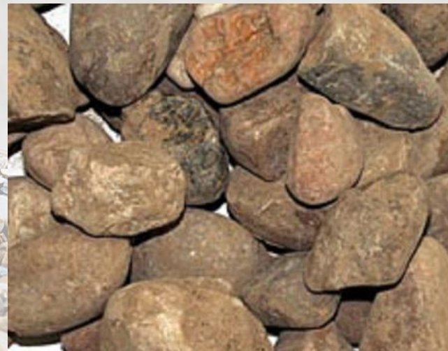
ГРАВИЙ, фракция 20-120 Мытая речная галька, размер гальки 20-120 мм