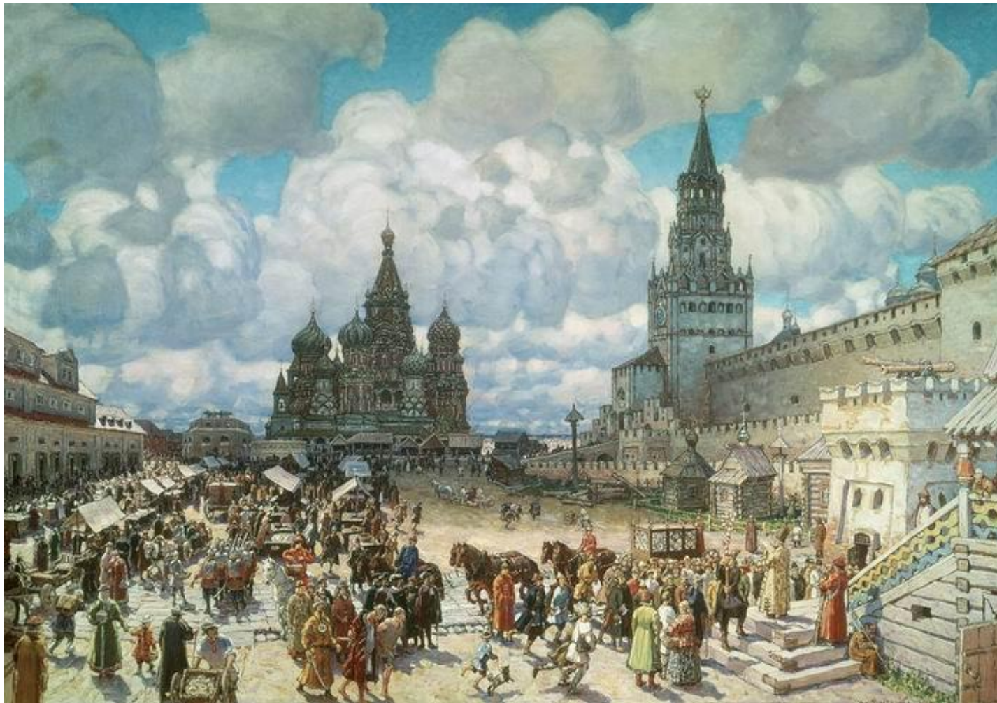
Васнецов. Красная площадь во второй половине XVII века