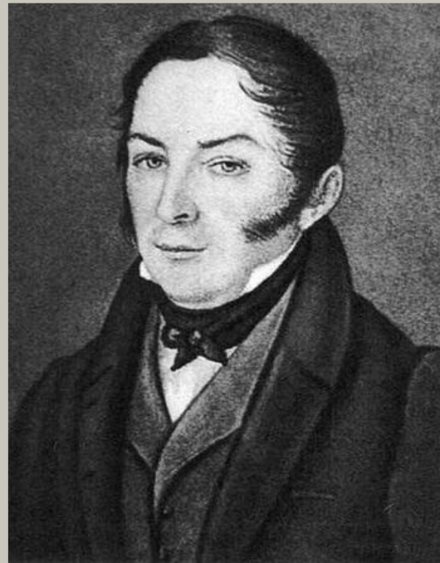
Осип Иванович Бове (1784 -1834) – российский архитектор