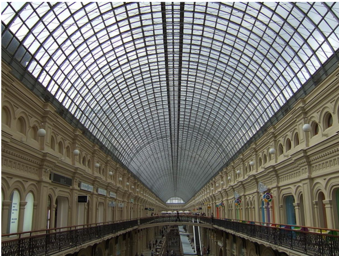
Металло-стеклянные перекрытия ГУМа конструкции Шухова