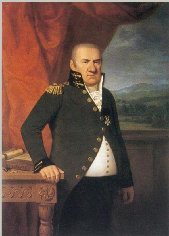
Джакомо Антонио Доменико Кваренги (1744-1817) – итальянский архитектор