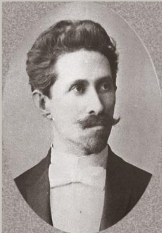
Александр Никанорович Померанцев (1849-1918) – русский архитектор