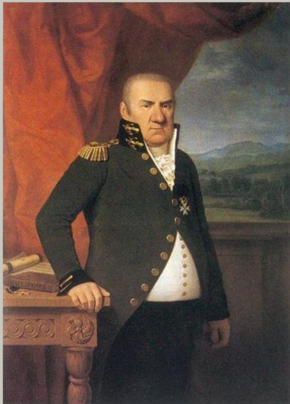
Джакомо Антонио Доменико Кваренги (1744-1817) – итальянский архитектор