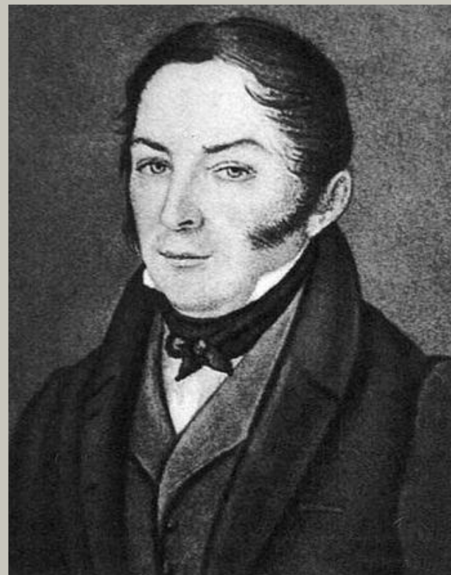
Осип Иванович Бове (1784 -1834) – российский архитектор