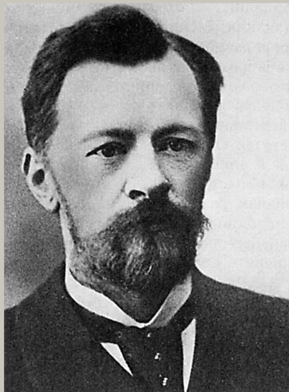
Владимир Григорьевич Шухов (1853-1939) - советский инженер, архитектор, изобретатель, учёный