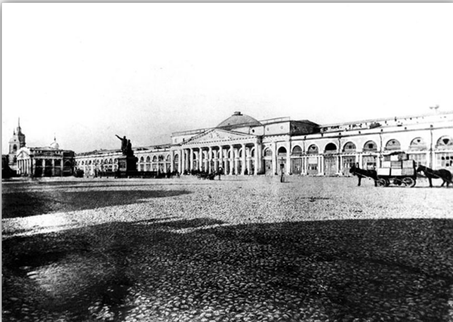
1815 год – новое здание верхних торговых рядов