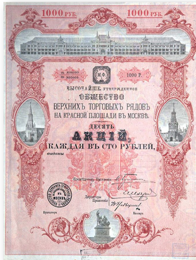
30 августа 1888 год – официальное открытие акционерного общества «Верхние торговые ряды»