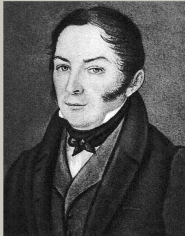
Осип Иванович Бове (1784 -1834) – российский архитектор