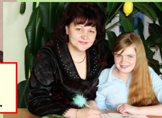
«Наглядная геометрия» - Окунева Л.С.