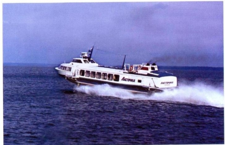
СПК «Ласточка».