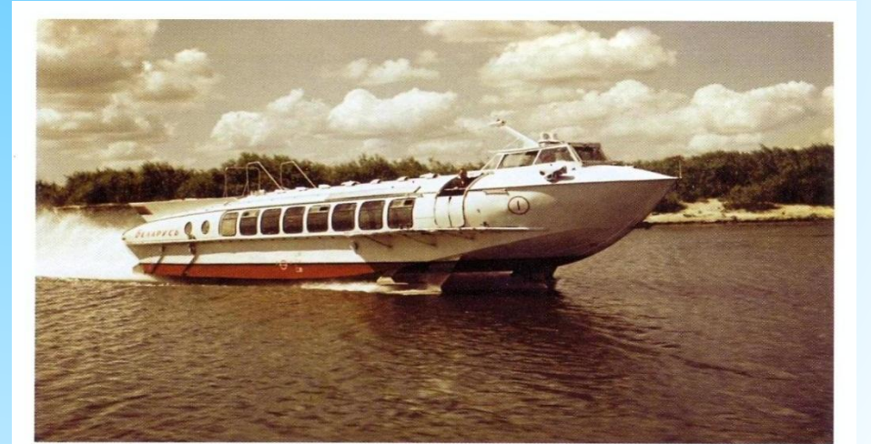
СПК «Беларусь».