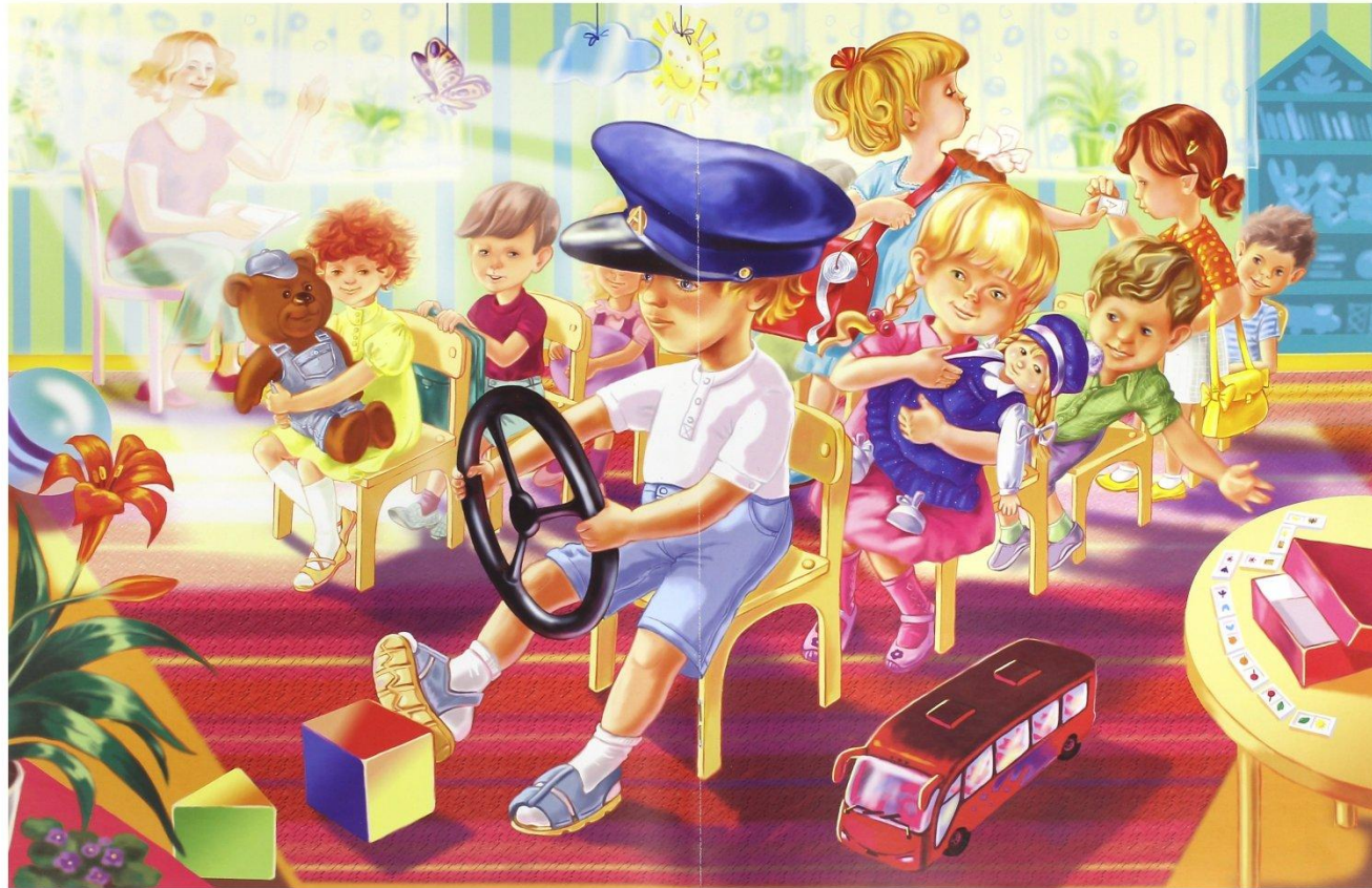
«РАБОТА ШОФЕРА ТРУДНА И СЛОЖНА...»

Работа дошкольного учреждения заключается в смысле деятельности ДООУ - подготовка ребенка к жизни в современном динамичном мире.