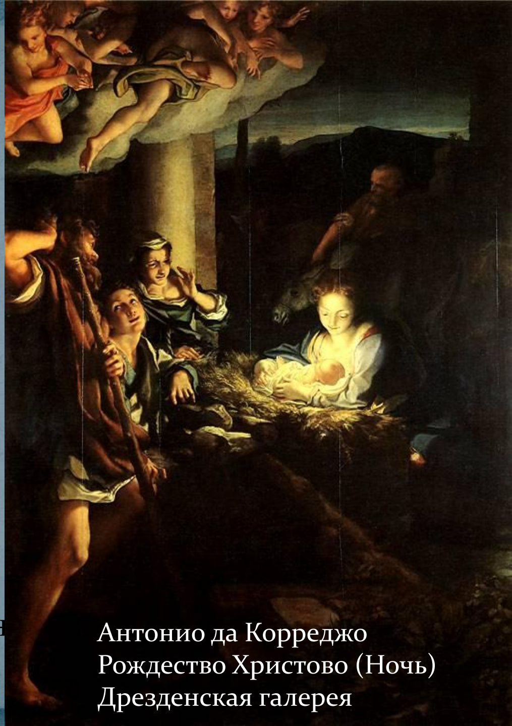
Антонио да Корреджо Рождество Христово (Ночь) Дрезденская галерея

Рождество – это один из главных христианских праздников. В России Рождество отмечается 7 января, а в Европе 25 декабря. Рождество – праздник семейный, отмечаемый в узком кругу близких людей. Ночь, накануне Рождества считается волшебной. Люди загадывают желания, и просят у Господа, чтобы он помог им их осуществить.