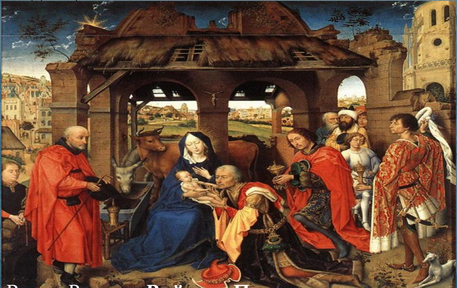
Рогир Ван дер Вейден. Поклонение волхвов

возрождение. Это рождение божественного младенца.