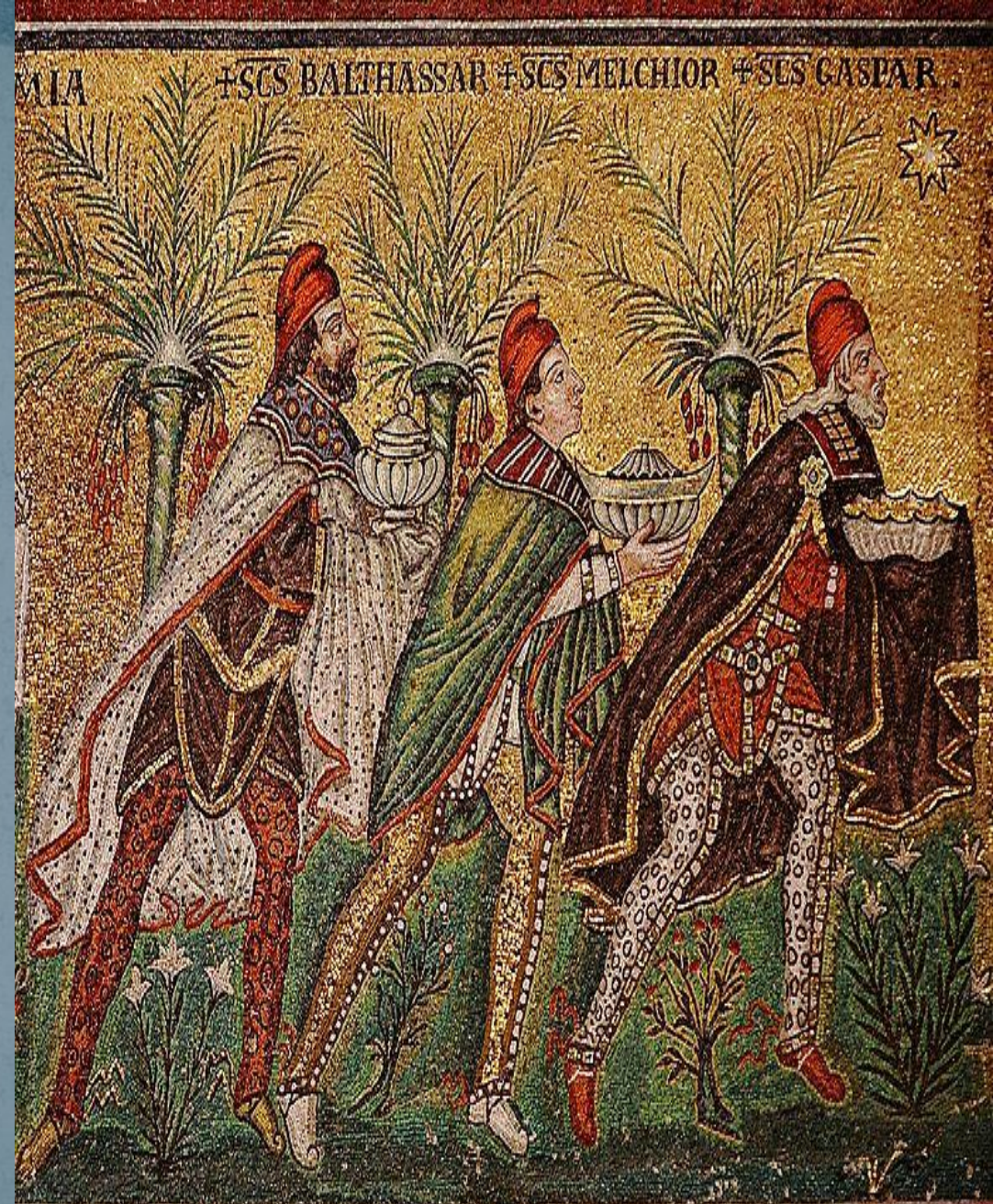
Мозаика в Равенна, VI в.

Считается, что традиция дарить подарки на Рождество была заложена именно волхвами.