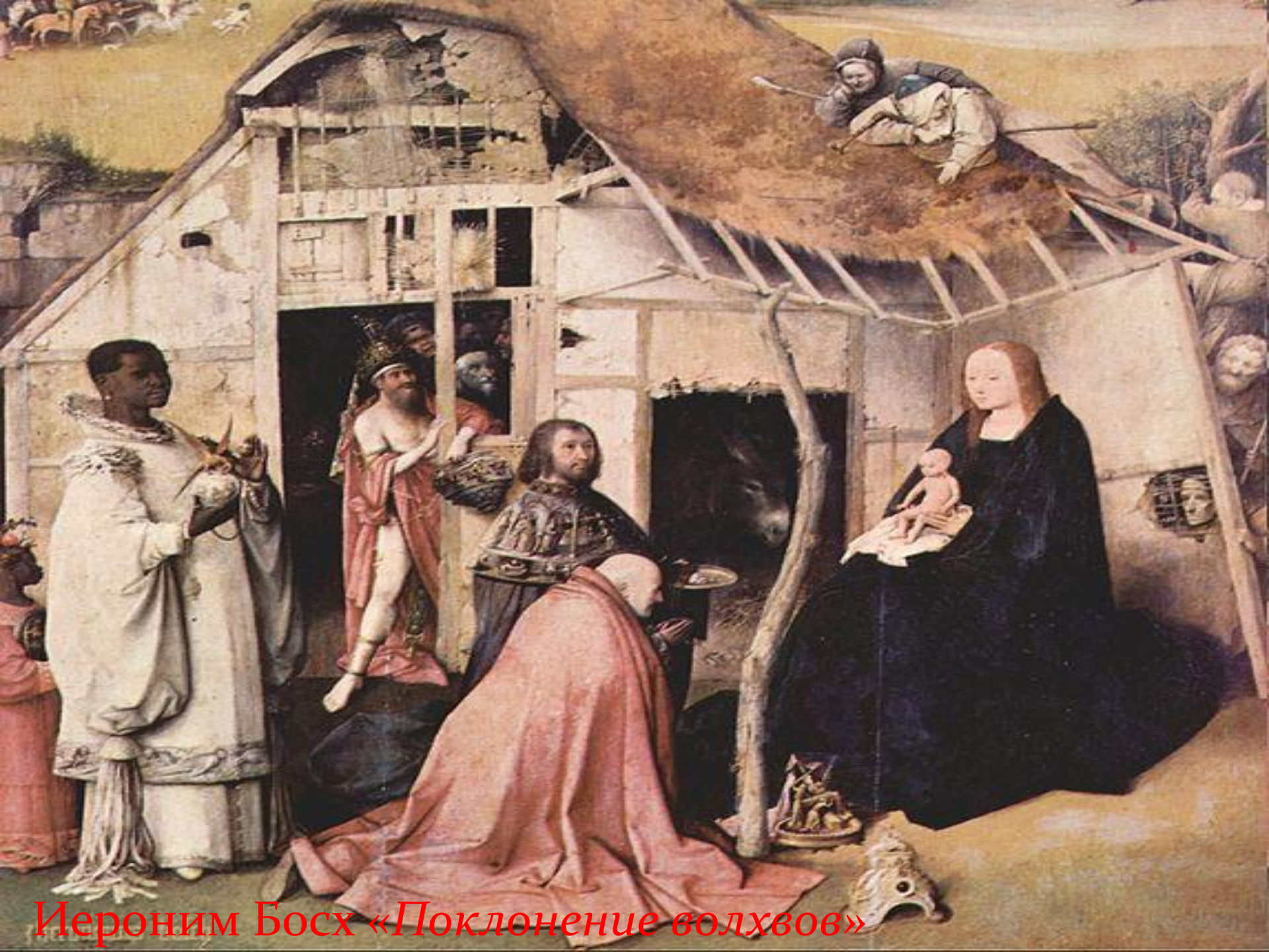
Иероним Босх «Поклонение волхвов»