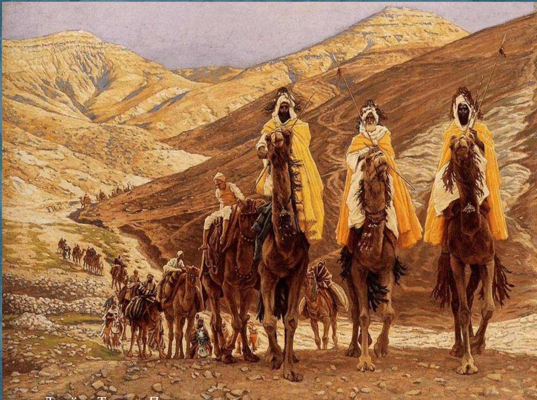
Джеймс Тиссо. «Путешествие волхвов»