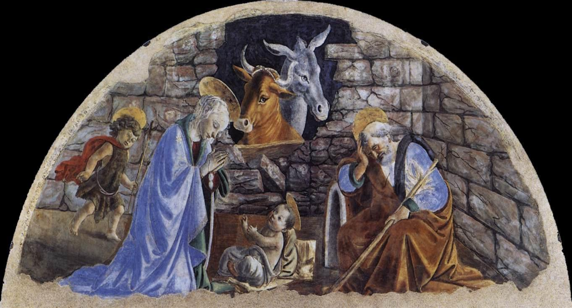
Рождество Христово Сандро Боттичелли церковь Санта Мария Новелла во Флоренции (Италия).