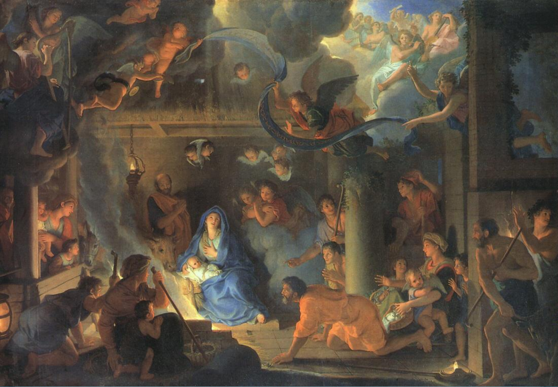
Поклонение пастухов Чарльз Ле Брун Лувр Париж Франция