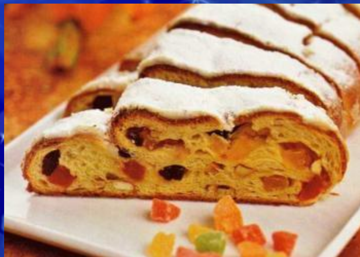
Штоллен – рождественский пирог