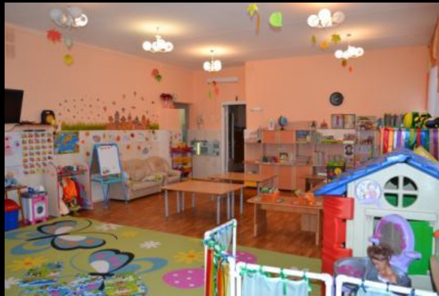
Верхняя правая точка