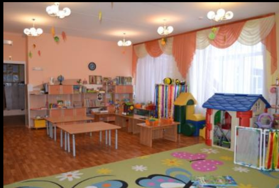
Нижняя правая точка

Вид младшая группа с четырёх точек по периметру