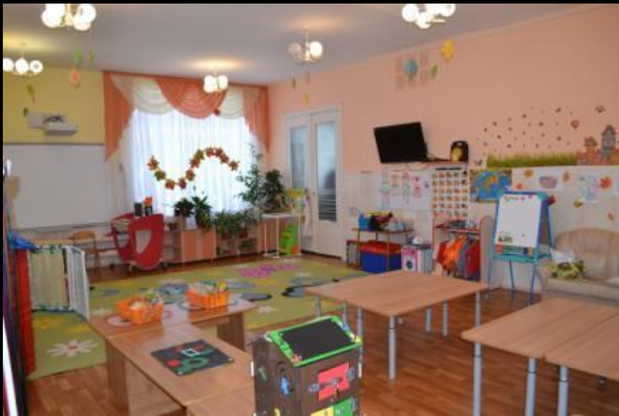
Верхняя левая точка