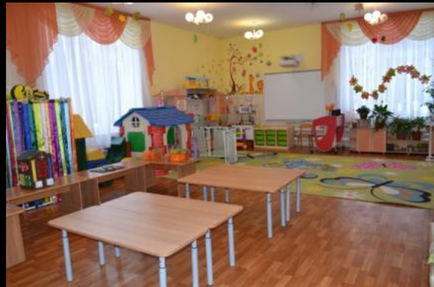
Вход в группу, нижняя левая точка